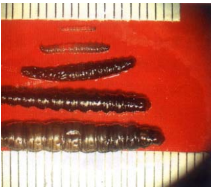
圖十八之三、斑螟蛾幼蟲有五齡