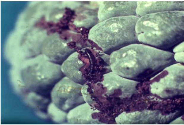
圖十八之一、斑螟蛾幼蟲危害果實外部狀