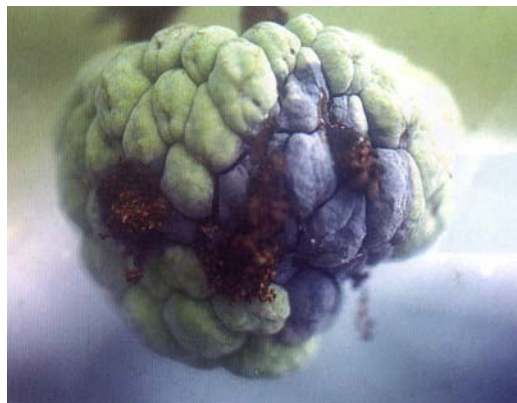
圖十九、斑螟蛾果實被害狀呈黑變木乃伊化