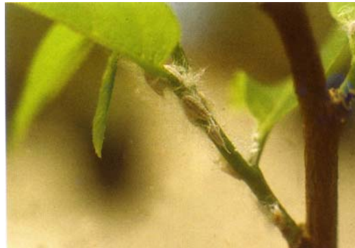
圖十之一、絲粉介殼蟲危害細枝條及果實狀