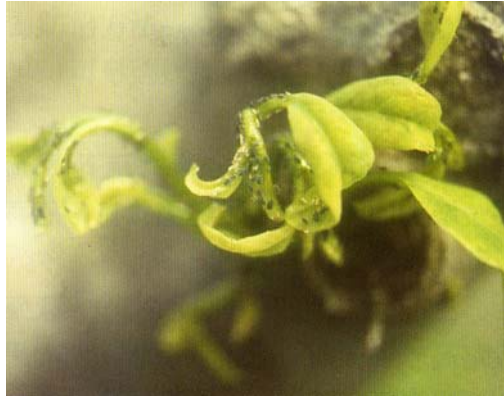
圖二、番荔枝心葉被蚜蟲取食危害後造成狹長雞爪狀