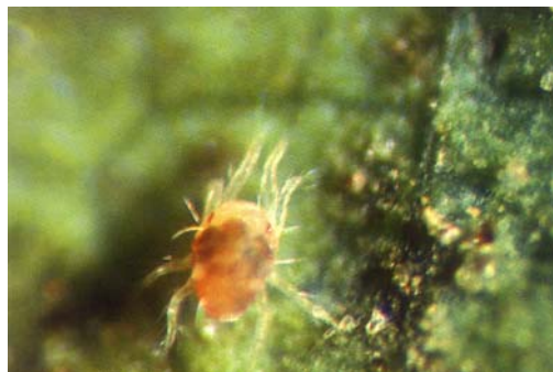
圖二十一、番荔枝神澤葉蟎棲息葉片上