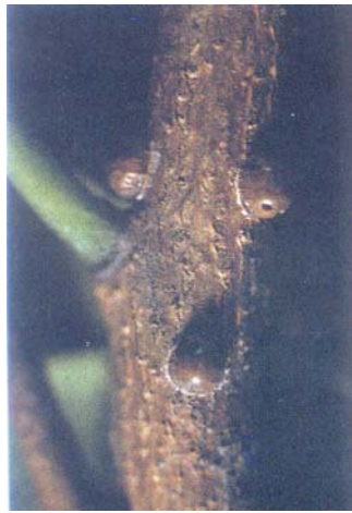
圖十五、咖啡硬介殼蟲危害枝條狀