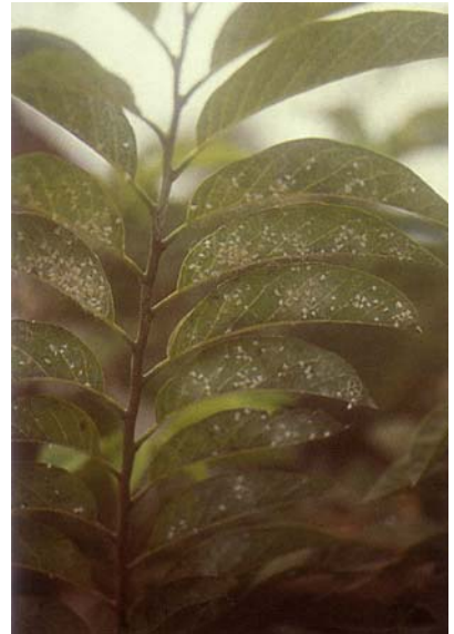
圖五、粉蝨成蟲、若蟲群聚葉背危害狀