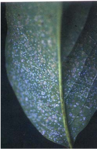
圖十四、淡薄圓盾介殼蟲危害葉片狀