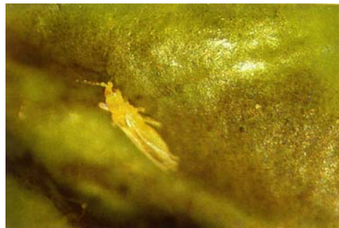
圖六之二、小黃薊馬棲息心芽處取食危害