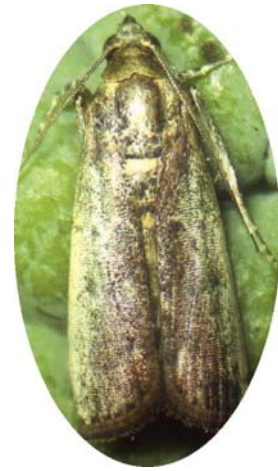
圖十六之一、番荔枝果實斑螟蛾成蟲