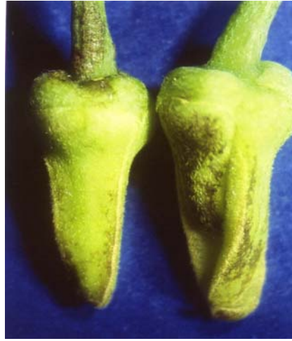
圖八、花柄及花瓣被小黃薊馬危害狀