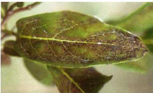
圖二十二、被害葉片沿葉脈呈銹色斑點