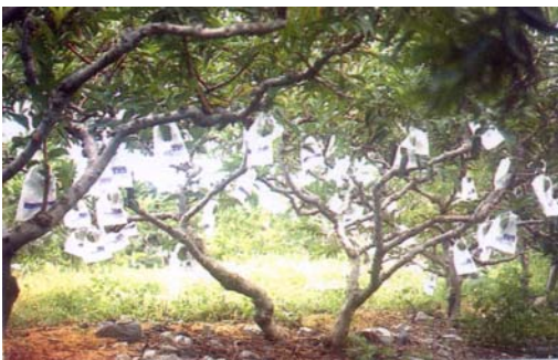
圖二十、果實套袋可防止斑螟蛾、粉介殼蟲、果實蠅等危害又可抗寒害