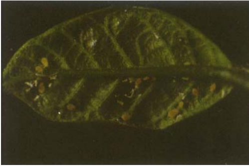
圖一、番荔枝蚜蟲群聚新葉上取食