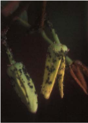
圖三、番荔枝蚜蟲危害花器狀