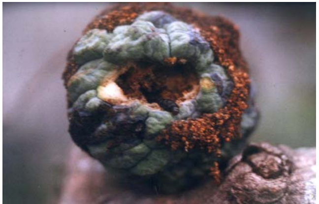
圖十八之二、斑螟蛾幼蟲危害果實內部狀