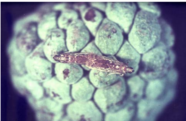
圖十六之二、斑螟蛾成蟲交尾狀