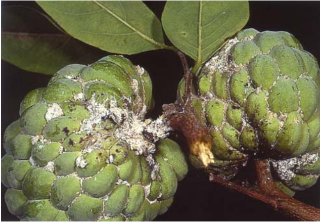
圖十二、果實被害狀