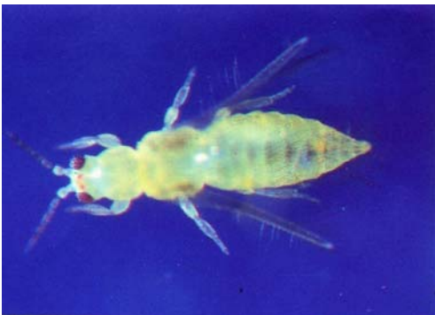
圖六之一、小黃薊馬的成蟲