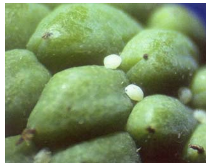
圖十七、卵粒產於果實鱗溝間