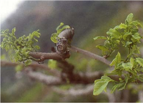
圖七、被小黃薊馬危害後心葉捲曲