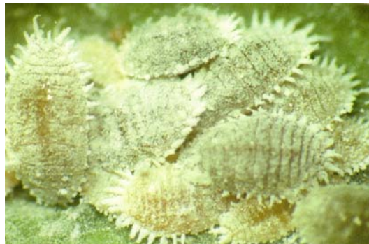
圖十一、太平洋粉臀紋粉介殼蟲群聚危害葉片