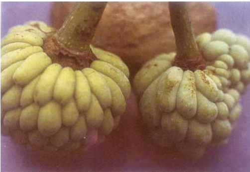
圖九、幼果果柄及果目被害狀