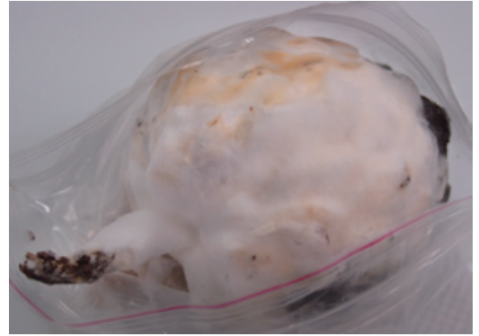
圖10. 菌絲生長快速，久置後，整顆果實布滿綿密的白色菌絲。