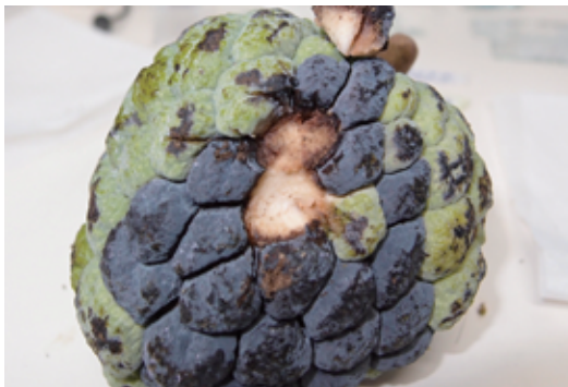
圖3. 炭疽病通常只危害至鱗目組織，不會侵入果肉。