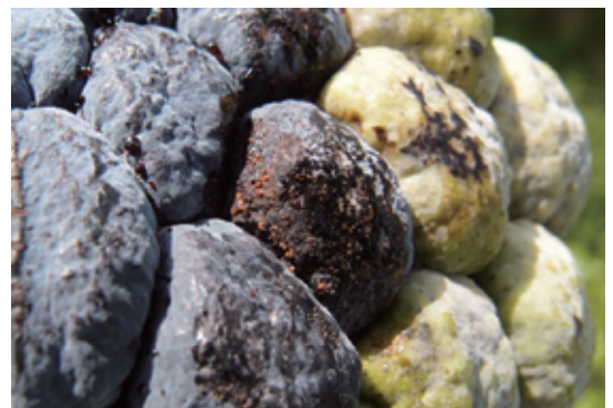
圖2. 病斑處久放後會滋生橘紅色孢子堆。