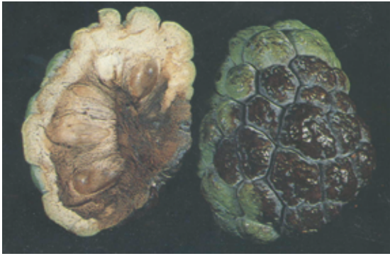
圖9. 病斑為紫黑色斑，水浸狀。會侵入果肉組織，病部前緣組織為水浸狀淡褐色。（圖/黃德昌）

田間管理： 以草生栽培或果園覆蓋防止雨水飛濺傳播病原，必要時再配合適當的藥劑防治。