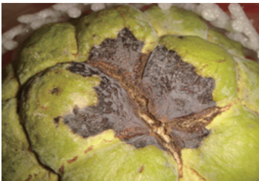
圖1. 病斑為灰黑色，粉狀質地，表面稍粗糙，有時會有龜裂現象。

田間管理： 當田間已有少數病果時，應修剪枝條增加通風，在下雨前後，配合藥劑防治，降低感染源。且將枝條病、果帶出園外銷毀。