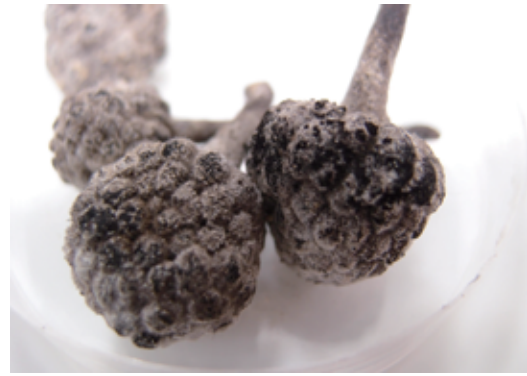
圖6. 菌絲白色，生長速度較炭疽病快且多，久置後，菌絲上會產生黑色粉狀孢子堆。