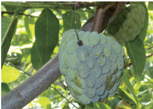
圖7. 觀察園區病果大部分發生在植株位置。

◎ 簡易濕室培養法： 將病果放入塑膠袋內，並將沾水衛生紙放置於袋中保濕，封袋放置觀察病斑上菌絲生長情形（圖8）。