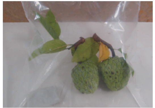
圖8. 簡易溫室培養法。