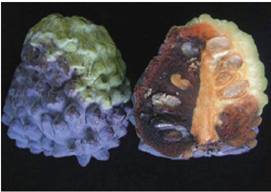
圖5. 病斑為紫黑色斑，粉狀質地。會侵入果肉內部呈黑褐色。

田間管理： 本病原菌廣泛存在於田間，果實感染後病勢進展快速，隨時清除病果集中銷毀，在普遍發生的果園可配合藥劑防治。