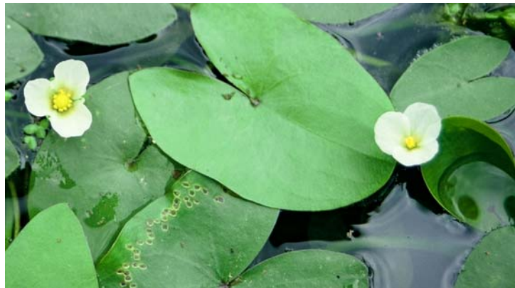
台灣冠果草之花(白色)