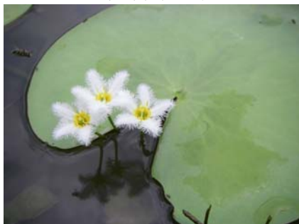
花生長於葉柄基部節處(葉下約 5 cm)