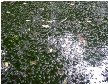
水蘊草族群生長情形