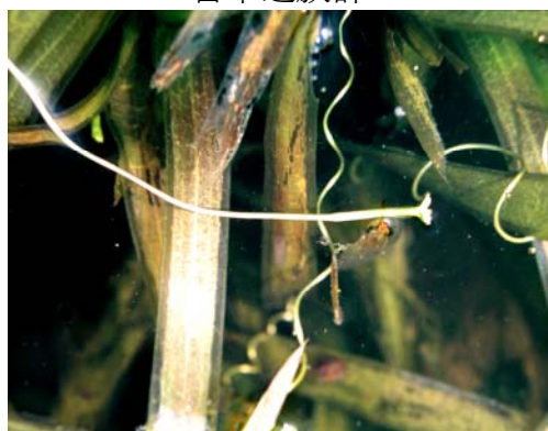
螺旋狀彎曲之花柄