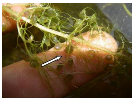
黃花狸藻之捕蟲囊