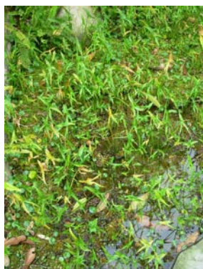
三腳剪族群生長情形