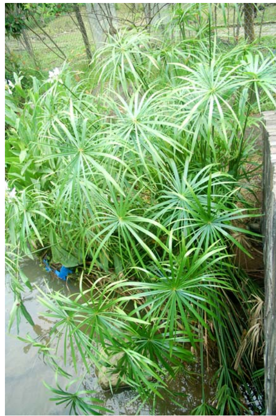
風車草植株之全景