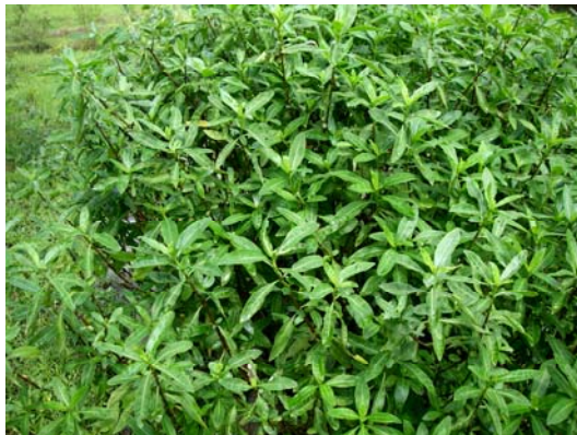
柳葉水蓼衣之族群生長情形