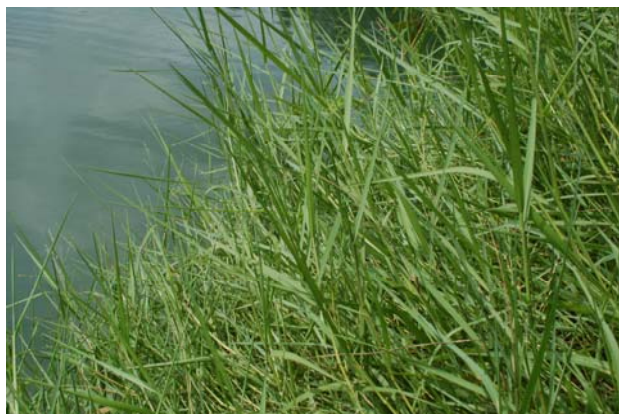
鋪地黍之族群生長情形