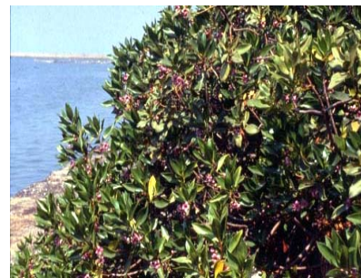
甜藍盤於海邊濱水處生長情形