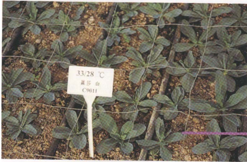
圖六：高溫育苗造成之簇生。 (王裕權、張元聰、王仕賢)