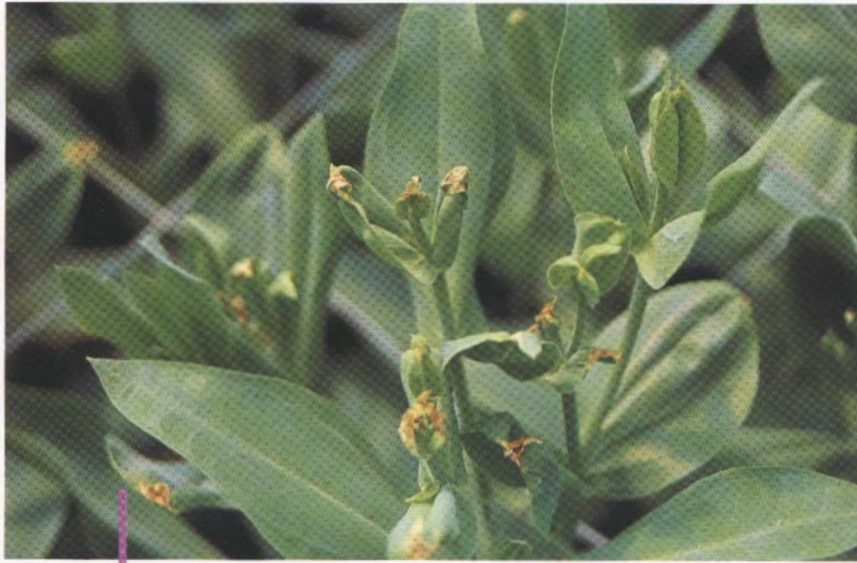
圖一：缺鈣。(王裕權、張元聰、王仕賢)

洋 桔梗栽培，一般常發現的生理障礙以設施內高溫、高溼所造成的缺鈣現象最多，其病癥為新生葉片葉緣呈現焦枯，嚴重時造成生長受到抑制，通常好發於春作初期及秋作初期夜間高溫時期，通常建議改善設施內通風及行葉面施肥的方式補充，使用的濃度為0.5%的氯化鈣水溶液，而影響洋桔梗的栽培最主要的生理障礙則是植株簇生化(rosette)的現象，洋桔梗發生簇生化(rose)現象後，造成植株停止生長，以外加荷爾蒙方式並無法打破簇生化現象，需經過一定低溫環境才能打破簇生化使植株再抽苔，目前農民常遭遇的問題是七至十月高溫下種植的苗株若發生簇生化停止抽苔，往往需經過冬季低溫才能打破，直到隔年三至五月才能採收，栽培時間延長造成損失。因此詳細介紹如下：