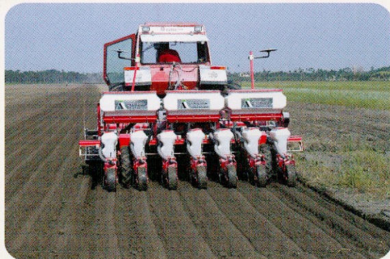
毛豆整地埋石施肥播種機

以曳引機附掛整地埋石施肥播種機可一次將田地裏的石頭、土塊與作物殘體埋入地下，並在表面形成鬆軟的細土層可直接播種。整地埋石施肥播種機可確保發芽率達95%，降低種植成本達50%以上，作業效率每小時