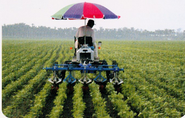
多功能中耕除草機

自動化桿式噴灌車臂長40公尺，可依灌溉量，設定每小時行走速度，較傳統溝灌節省水資源達80%以上，作業效率每小時約0.3~0.4公頃，此機械仍有相關技術待改進。其原理主要是將水管車與桿式噴水臂連結在一起，水管車輸送水，而桿式噴水臂噴水灌溉農地。水管車利用所輸送的水的動力自動回收水管，回收的速度主要決定於汲水幫浦的流量及灌溉的濕度，桿式噴水臂的灌溉速度則與水車回收的