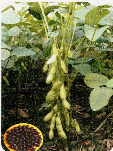
毛豆『綠蜜—高雄6號』(左)及『黑蜜丹波—高雄7號』(右)

豆在短時間內送至加工廠立即以色澤選別機剔除格外品後，再以先進設備殺菁冷凍，而使採收送廠的原料毛豆，其莢色、甜度、風味及品質均在最佳狀態完成加工冷凍過程，因此台灣產冷凍毛豆特別優質安全，可讓消費者吃的安心又健康。