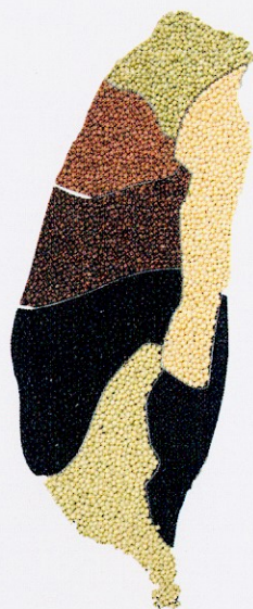
台灣不同種皮色的毛豆

我國已加入世界貿易組織（WTO），各項農產品面臨市場開放與降低關稅的壓力，對於國內農產品的產業結構發生重大衝擊。生產成本偏高或競爭力較弱的產業必須調整或轉型，而具競爭力的產業則需積極拓展外銷，以確保產業永續發展。台灣毛豆是具有競爭力的產業，三十年來產品以高品質及高價位方式行銷，在國際市場已佔有一席之地。為鞏固台灣毛豆在國際市場的佔有率，利用企業化大農場栽培，以降低毛豆生產成本，進而提高毛豆產品在國際市場競爭力。本場在「國家科學技術發展基金」經費支持下，在高屏地區已建立毛豆大農場機械化栽培1,900公頃，有效降低生產成本達20%，每公頃約可增加豆農16,000元收益，以大農場每年春秋兩作3,800公頃估算，年收益可增加6仟萬元。但大農場租金每年高漲，農田不平整，灌溉排水困難，尚有許多相關問題待解決。因此本場將繼續推動毛豆大農場機械化生產，提供消費者新鮮、優質、安全、價格合理的產品，以提升台灣毛豆產品在國際市場的競爭力。