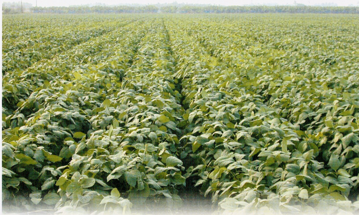
台灣毛豆大農場企業化經營

毛豆為大豆的前身，由於毛豆之採收標準在全株有85%以上的鮮莢果達八分飽滿，豆莢仍翠綠毛茸茸時（即R6期）即行採收，故名為「毛豆」，在日本稱為枝豆。英文則有多種稱呼，如：vegetable soybean、garden soybean、green soybean或edamame。毛豆屬外銷型產業，是目前外銷農產品中最大宗的作物，民國92年外銷量為29,949公噸，年外銷金額為4,821萬美元，即每年為國家賺取新台幣約16億6,000萬元的外匯，其中冷凍毛豆輸日外銷量為26,325公噸，較91年成長11.6%，比中國大陸之20,635公噸多27.6%，雖然佔日本進口量42.9%，但目前已面臨中國大陸及東南亞等國家的低價競爭。