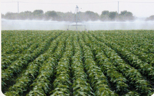
自走式桿式噴灌車