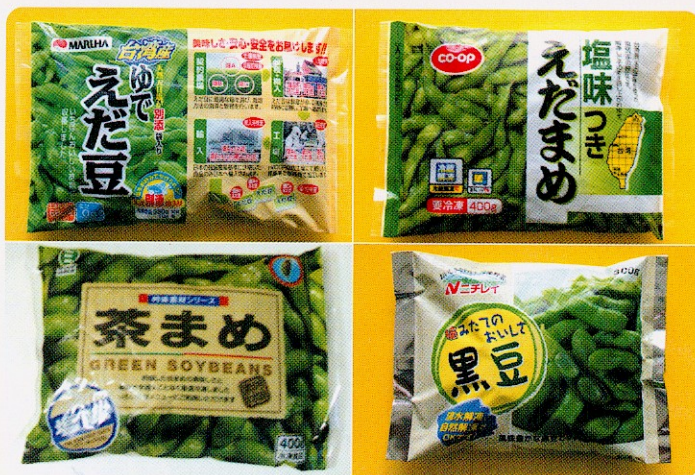
台灣優質安全毛豆產品

本場為強化台灣毛豆外銷競爭力，降低生產成本，與台灣區冷凍蔬果工業同業公會及收佳股份有限公司合作，引進整地埋石施肥播種機具、多功能中耕除草機具、桿式噴藥機具及自動化桿式噴灌車等四種大型農機，配合國內已有FMC7100型採收機，在高屏地區進行「毛豆大農場機械