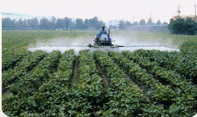
多功能桿式噴藥機