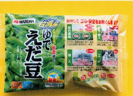
殺菁冷凍加工製成優質毛豆產品外銷