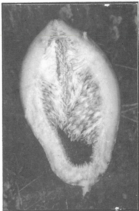
圖1. PCPA100ppm噴施愛玉全株後，誘導隱頭花序內瘦果單偽結果

Fig 1. Parthenocarpic fruit set induced by sparying PCPA 100ppm to synconia of Jelly Fig.