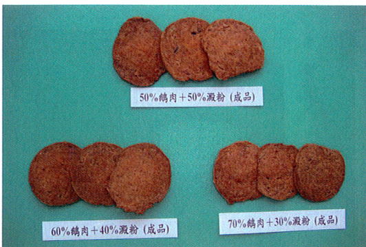
圖6. 乳化酥脆鵝肉乾