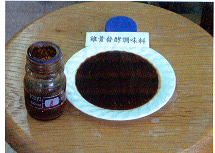
圖5. 自行開發之發酵醬料