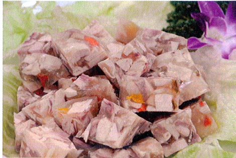
圖4. 調味凍膠雞肉蔬菜凍