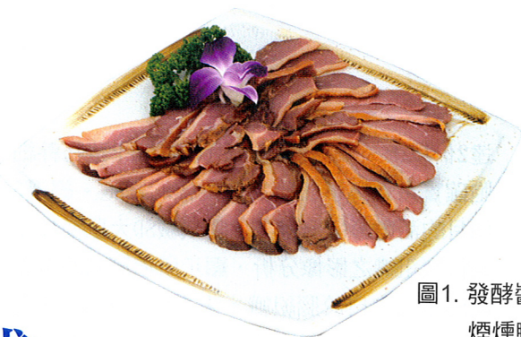
圖1. 發酵醬料 煙燻鴨排

根據資料顯示，台灣因屆齡淘汰之家禽，其數量肉種雞每年淘汰約280公噸，紅面鴨每年淘汰約190公噸，蛋鴨每年淘汰約1,500公噸，而老鵝每年淘汰約750公噸。然而老年種禽肉量少且肉質堅韌，甚難直接烹調食用。因此，本所嘗試利用新式加工技術製作多種半調理或調理禽肉加工產品，提供業界應用之參考，亦歡迎有興趣的業者與本所技術服務組連絡，洽談進一步合作事宜。