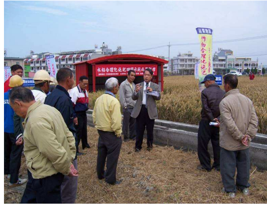
苗栗地區水稻合理化施肥田間示範成果觀摩情形