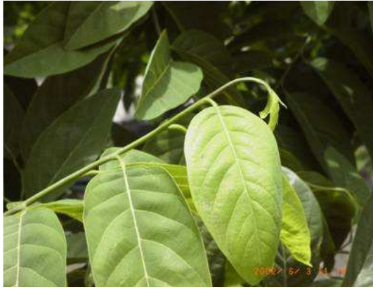
氮過多容易引起鳳梨釋迦枝梢生長時 葉片下垂的現象