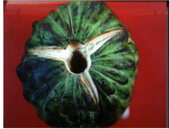
氮素施用過多導致鳳梨釋迦果蒂脫落 之落果現象