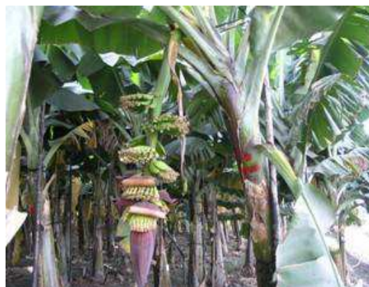
合理施肥之香蕉果串