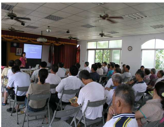
合理化施肥講習會場

蕉園「合理化施肥」的意義係為作好蕉園肥培管理工作，在獲得最佳的蕉株生育、產量和品質之外，亦希望能避免施肥過量所導致的土壤品質劣化和黃葉病為害，來降低生產成本，提升植蕉收益，從長遠的角度衡量，即是為了維護香蕉產業的永續經營與發展。「合理化施肥」的農業推廣教育是政府農政單位的義務工作，應長期性的編列經費，透過各種農業管道將正確、合理的施肥訊息傳遞給農民，並應特別針對新一代的蕉農進行培訓，以收事半功倍之效。