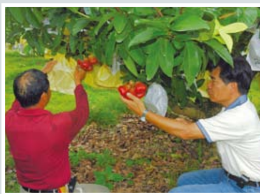
▲ 合理化施肥成效良好，吸引農民前來參觀