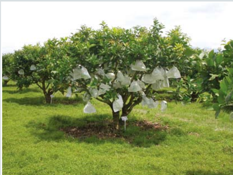
▲ 蓮霧合理化施肥果實套袋情形

宜蘭蓮霧栽培於水田轉作地區，氣候高溫多濕，土壤為強酸性，農地缺乏有機質，果農因喜愛多施化學肥料，不但造成無謂的施肥浪費增加成本的支出，而事實上根據本場實地查訪蓮霧栽培果農之施肥情形，氮、磷、鉀之年施肥量均比推薦量增施30~35%左右，又根據本場試驗結果，在酸性土壤栽培蓮霧必須先行土壤改良及增施有機質肥料，不但可降低化學肥料之施用量，更可提高蓮霧品質，因此建議蓮霧果農先送土壤及葉片植體到本場進行檢測，並依據化驗結果推薦的最適施肥量，擬定合理化施肥策略，將可降低施肥成本，提高蓮霧品質增加農民收益。