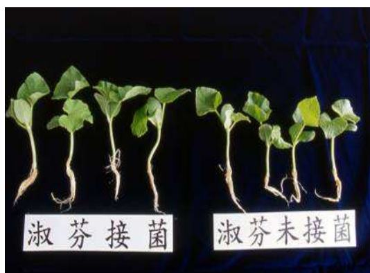
接種菌根菌可促進洋香瓜幼苗生長(左)