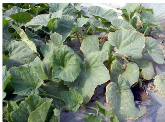
施肥過量植株呈鹽化症狀