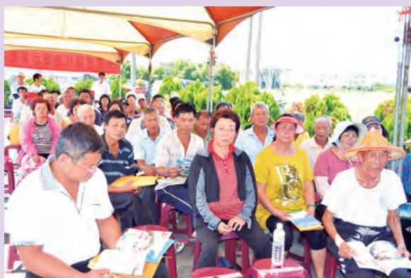
▲青蔥合理化施肥觀摩會開會情形