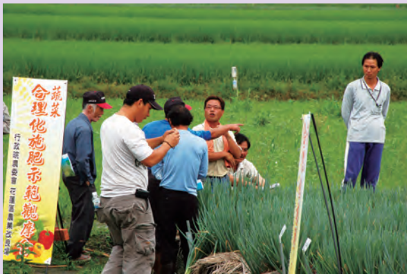
▲農友觀摩青蔥合理化施肥示範田

均顯示合理化施肥與對照農民慣行施肥區在園藝性狀上並無顯著差異，證明農友降低肥料使用量，仍可維持青蔥生育正常、品質良好，且每分地可節省肥料成本270~490元。為確切掌握土壤的肥力狀況及擬定合理化施肥策略，建議農友在種植青蔥前約1個月，先送土樣到本場檢測土壤肥力，並依據化驗結果推薦的最適施肥量，擬定合理化施肥策略，將可確保青蔥產量、品質俱佳，且降低生產成本。