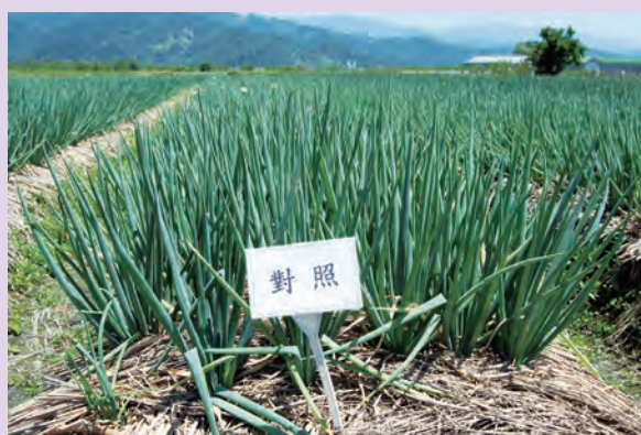
▲青蔥施用溶磷菌配合減施化學肥料處理之生育情形良好(左)