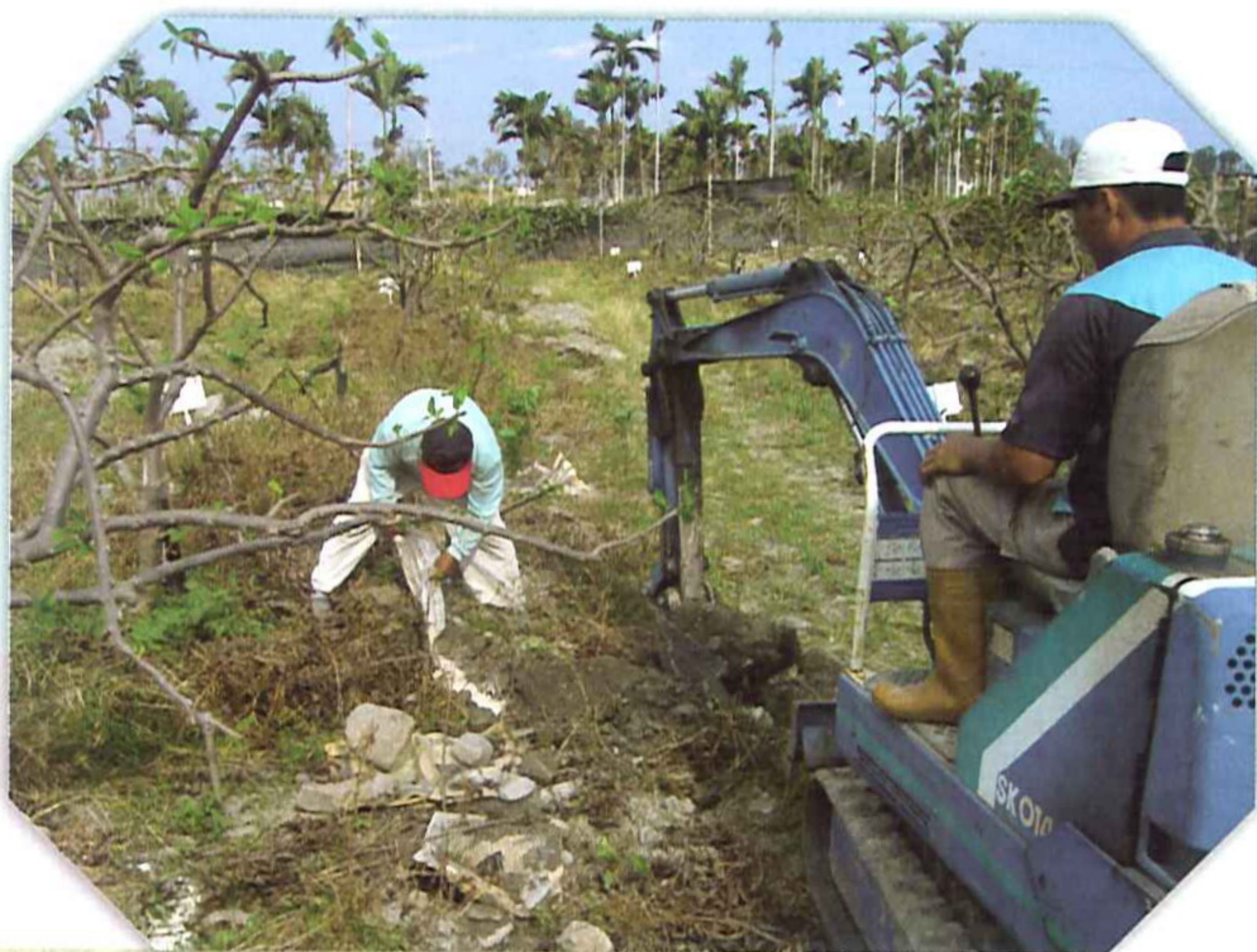
圖6. 施用苦土石灰，要與土壤充分混合