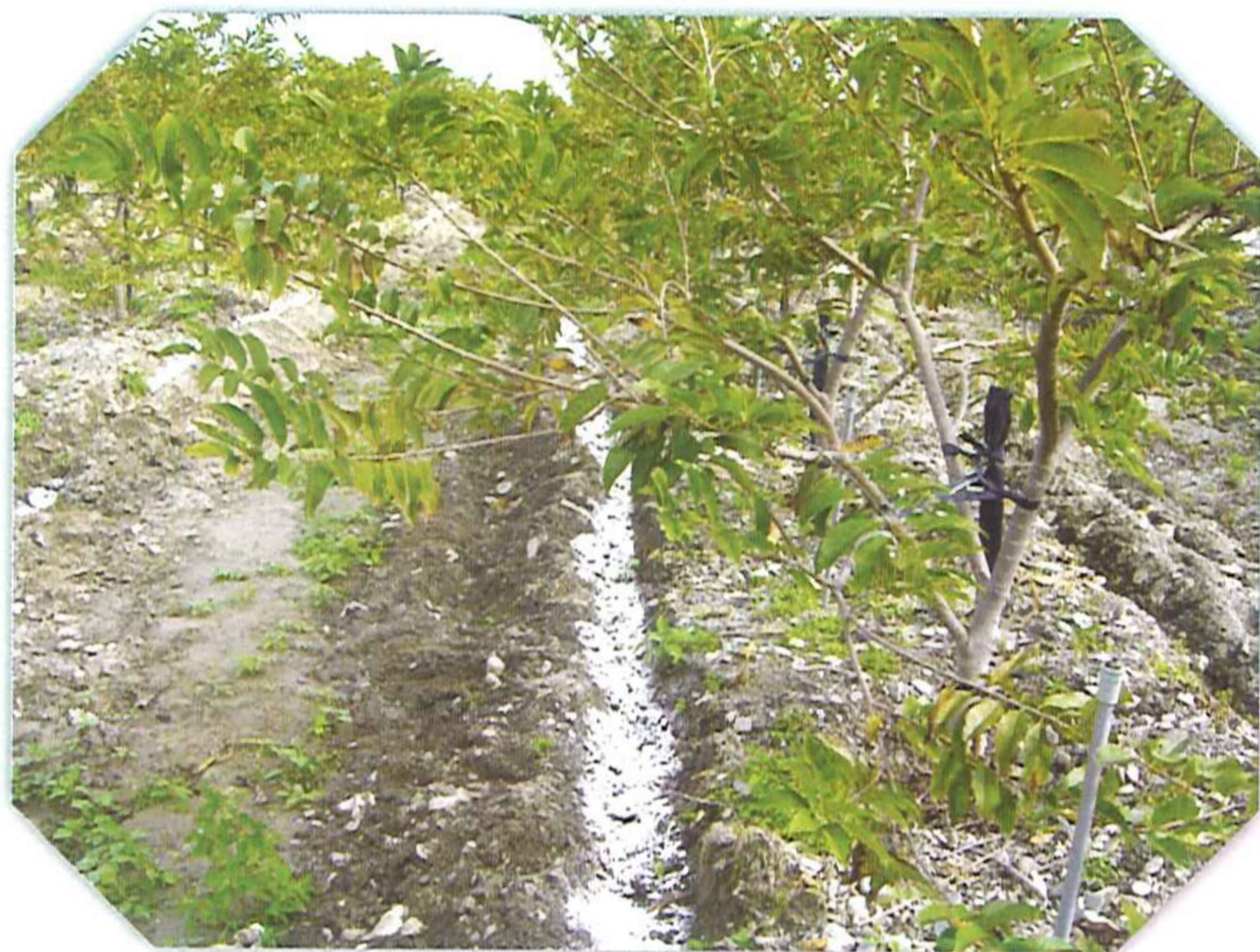
圖5. 番荔枝果園開溝施用苦土石灰之情形