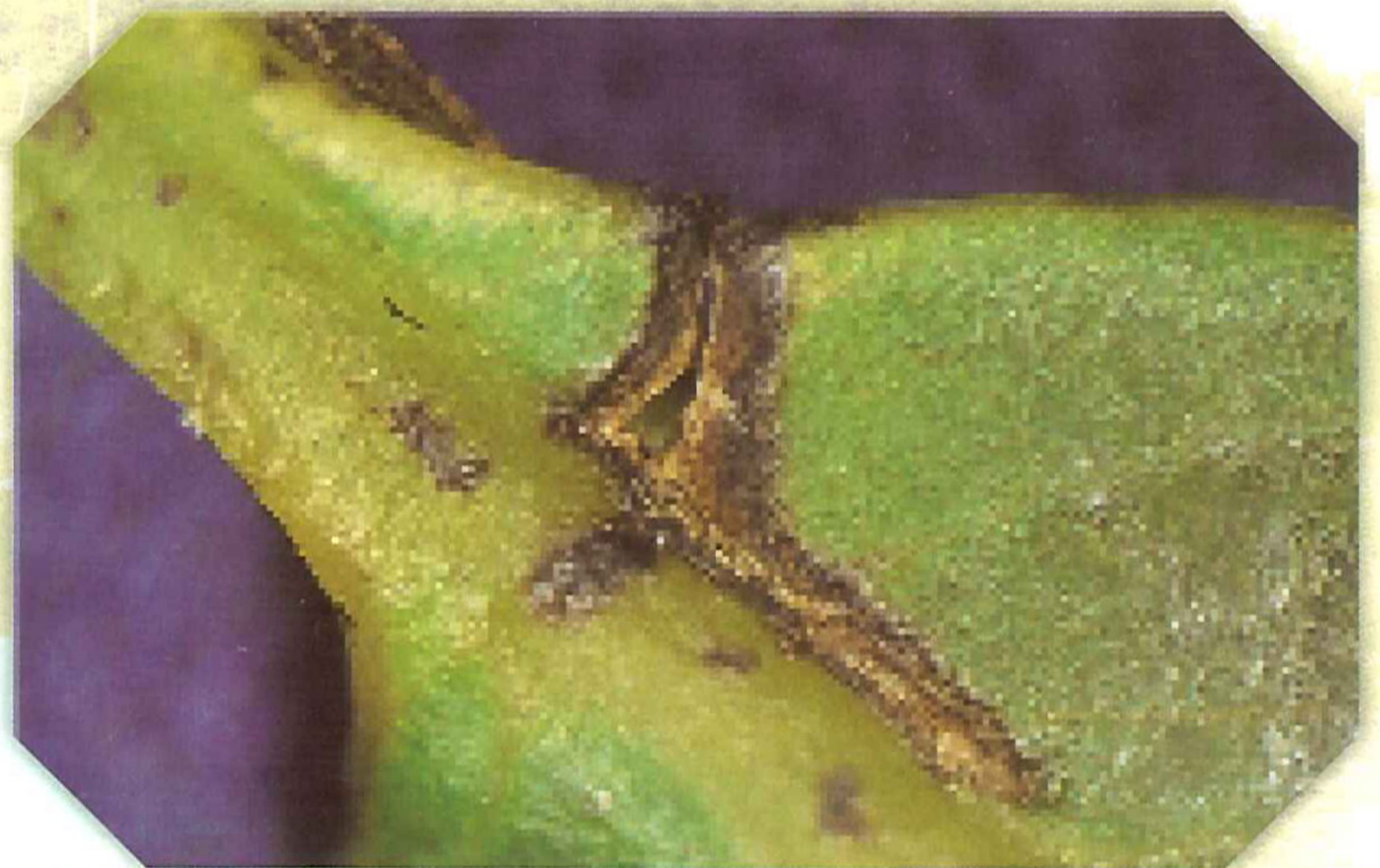
圖4. 番荔枝缺硼時，葉柄與葉身接合處附近亦會發生橫向龜裂後再往葉身縱裂