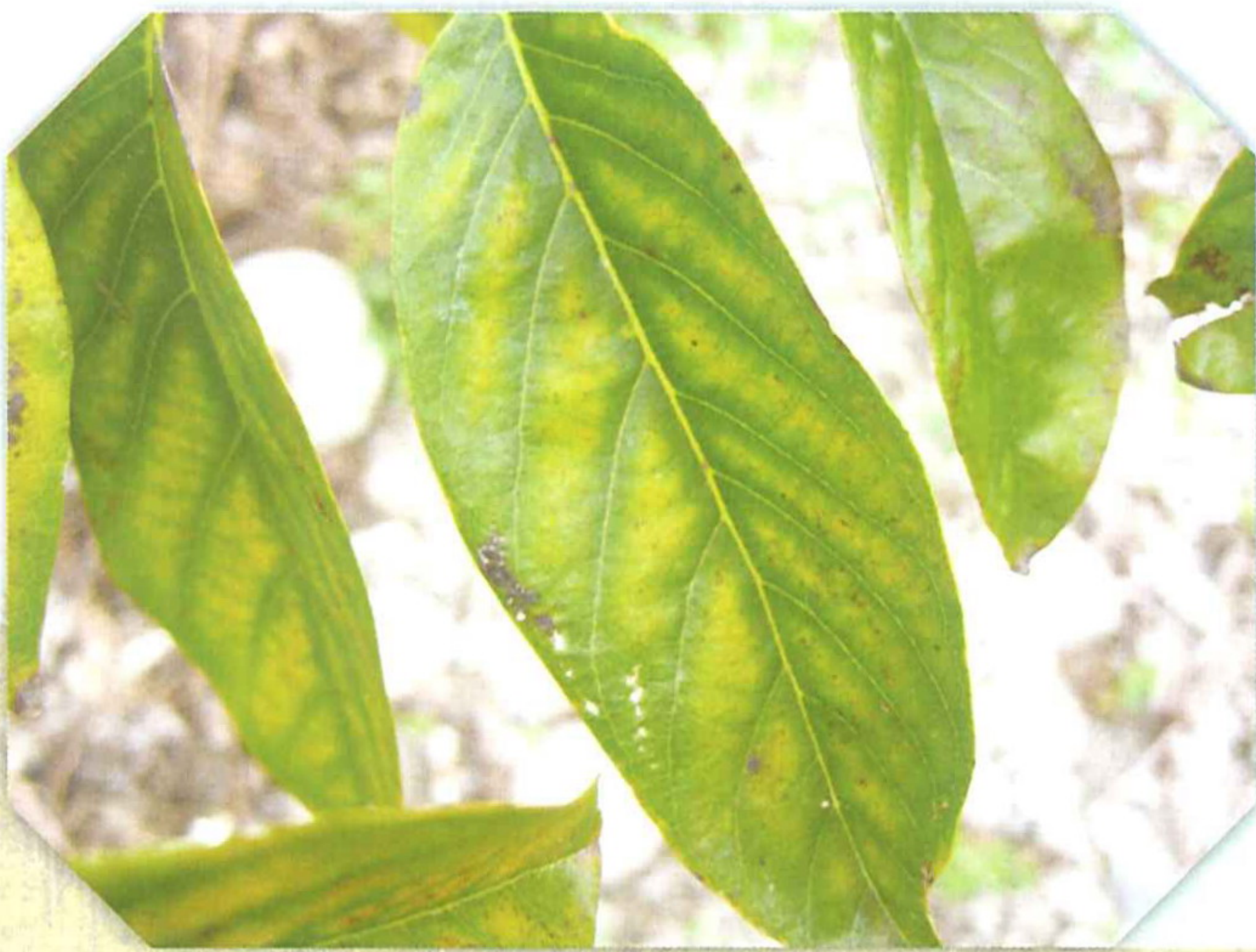
圖3. 番荔枝葉片缺鎂時，老葉葉脈間部分有黃化現象，且與葉脈周圍之綠色有明顯對比者