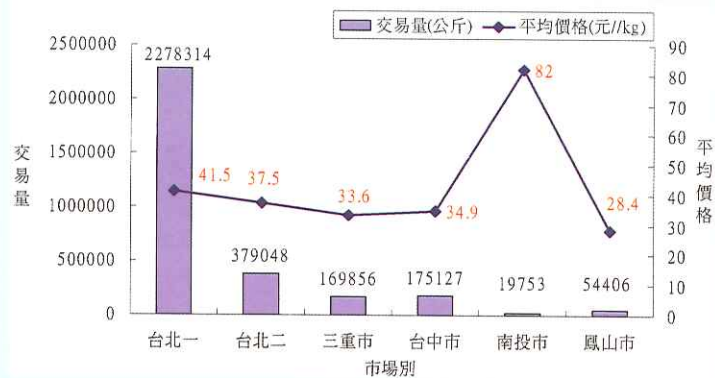
圖1. 98年批發市場茭白筍(花殼)交易量與平均價格