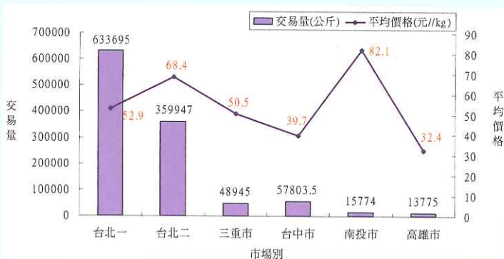
圖3. 98年批發市場茭白筍(去殼)交易量與平均價格