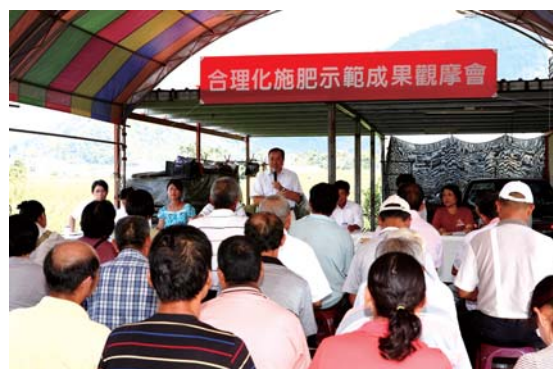
茭白筍合理化施肥示範成果觀摩會盛況之一