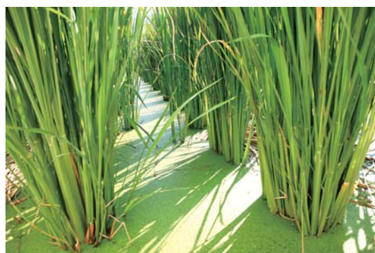
茭白筍合理化施肥區在田間生育良好