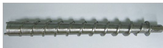
螺旋榨油機之錐形螺旋軸心