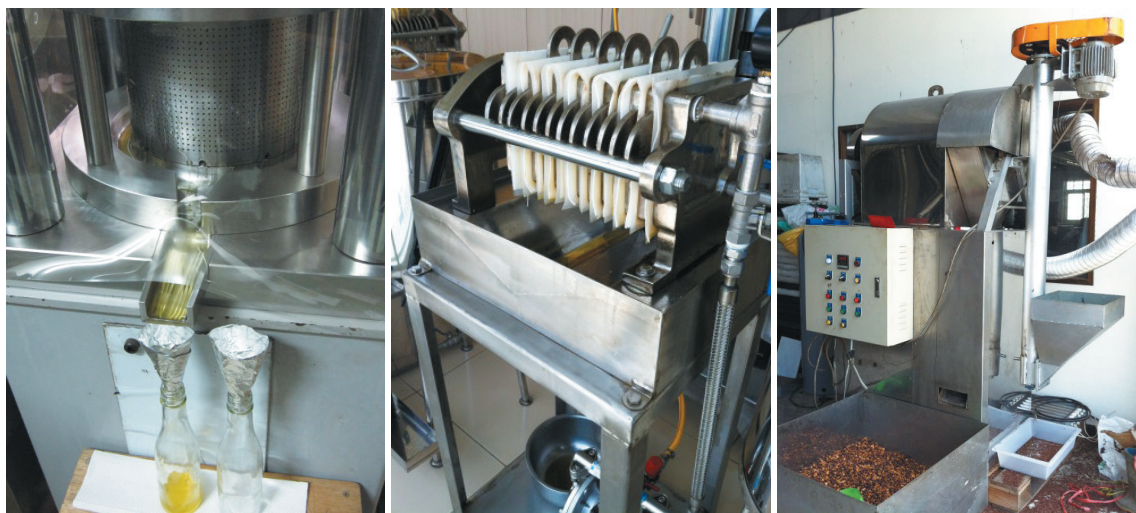
圖左：直壓式榨油機之榨油情形。圖中：所得油品需經沉澱及過濾機處理。圖右：種籽榨油前需經炒焙以除去多餘的水份