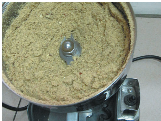
「餅式榨油法」之茶籽種仁需先予以粗碎