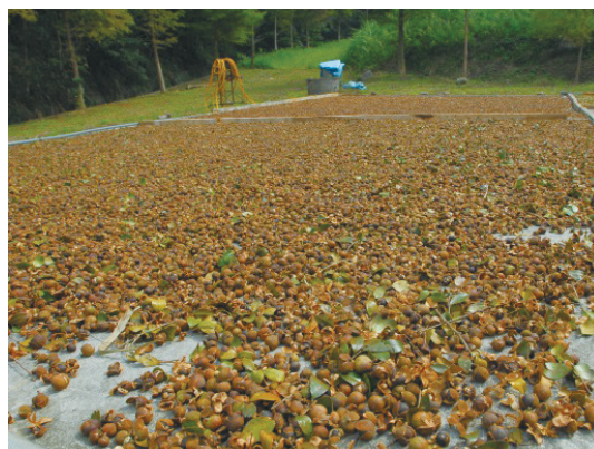
天然日曬乾燥中的油茶籽

以苦茶油種子(油茶籽)為例，手工摘取的油茶籽需先乾燥至適當含水率，去除果殼、種殼、未熟果、雜質及瑕疵品，得到優質種仁，才能開始榨油。「餅式榨油法」之種仁需先予以粗碎、水蒸、整形，再以機械由圓餅兩端施予垂直之壓力榨取油脂，所得油品尚需經沉澱及過濾之程序。目前亦有改良的餅式榨油機，不需粉碎、水蒸、整形等過