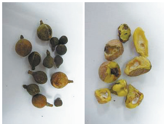
小果油茶籽未熟果(左)及瑕疵品(蟲粒及霉粒)