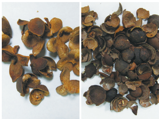
小果油茶籽果殼(左)及種殼(右)