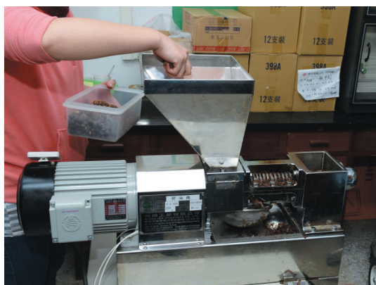
螺旋榨油機之榨油情形