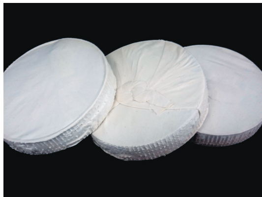
粗碎之油茶籽種仁經水蒸後，製成圓餅狀，以進行餅式榨油