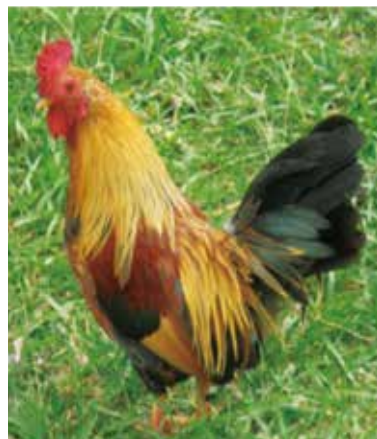
雞隻是重要的飼養家禽，也是人類主要的蛋白質來源之一。

海鮮、家禽、家畜等製品是人類主要的蛋白質來源，其生產過程涉及食品安全。然而，為了提供足夠的產量，養殖者開始大規模密集飼養動物（例如雞隻），導致飼養環境容易發生病原菌傳播。為了減少經濟動物死亡，養殖者便大量使用抗生素或其他藥物，造成藥物的殘留。嚴重濫用或誤用，也會造成病原菌產生抗藥性，衍生公共衛生問題與疾病傳染。因此，藥用植物對於動物疾病的預防與治療將在食安上扮演重要的角色。