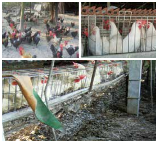
野放雞（左上）和密飼雞（右上）相比，有較大的活動空間，並因避免了密飼雞滿地糞便和擁擠的環境（下）而減少疾病的傳播。