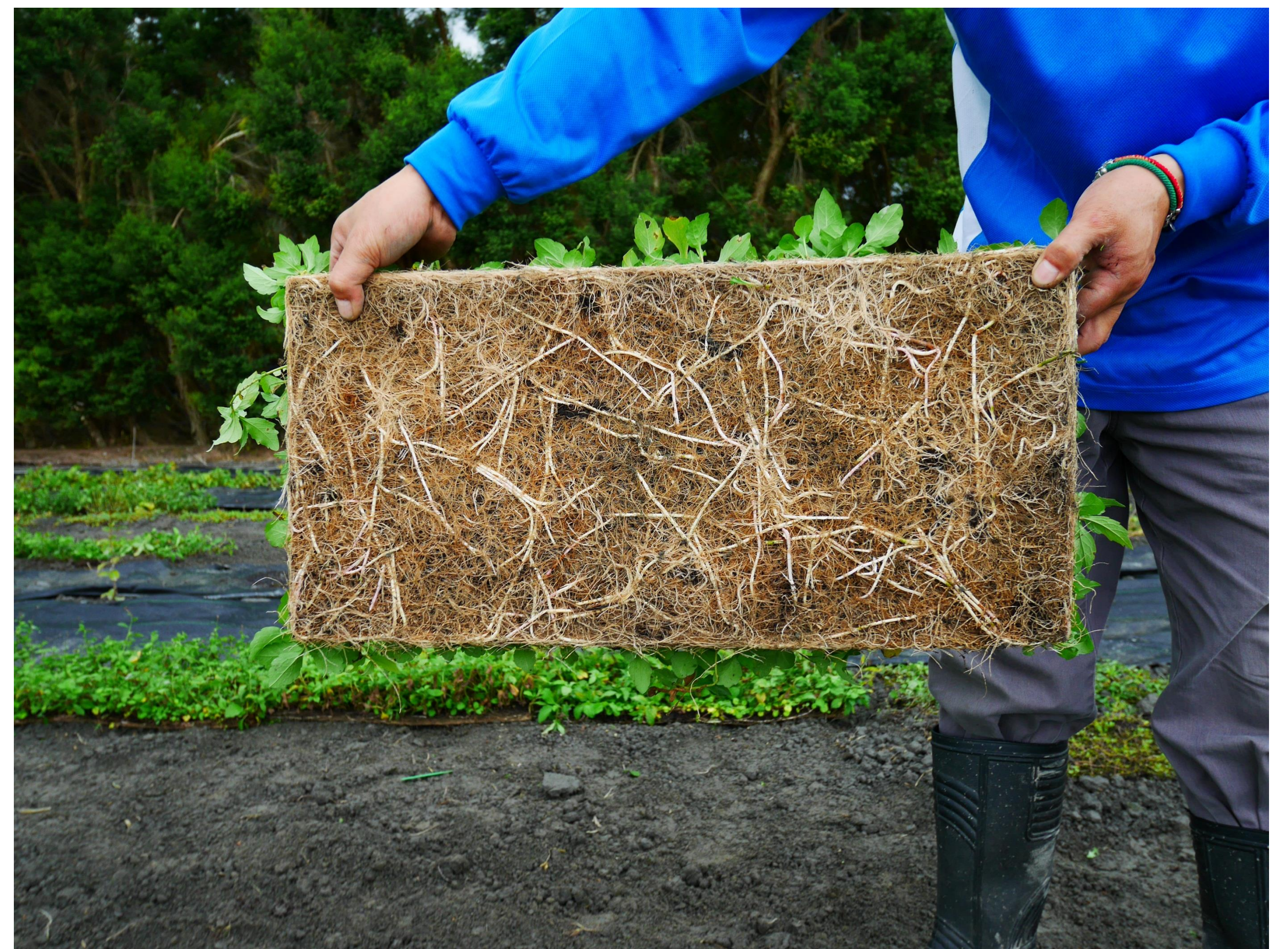
原生野花植生毯根系強健可直接整片鋪設。