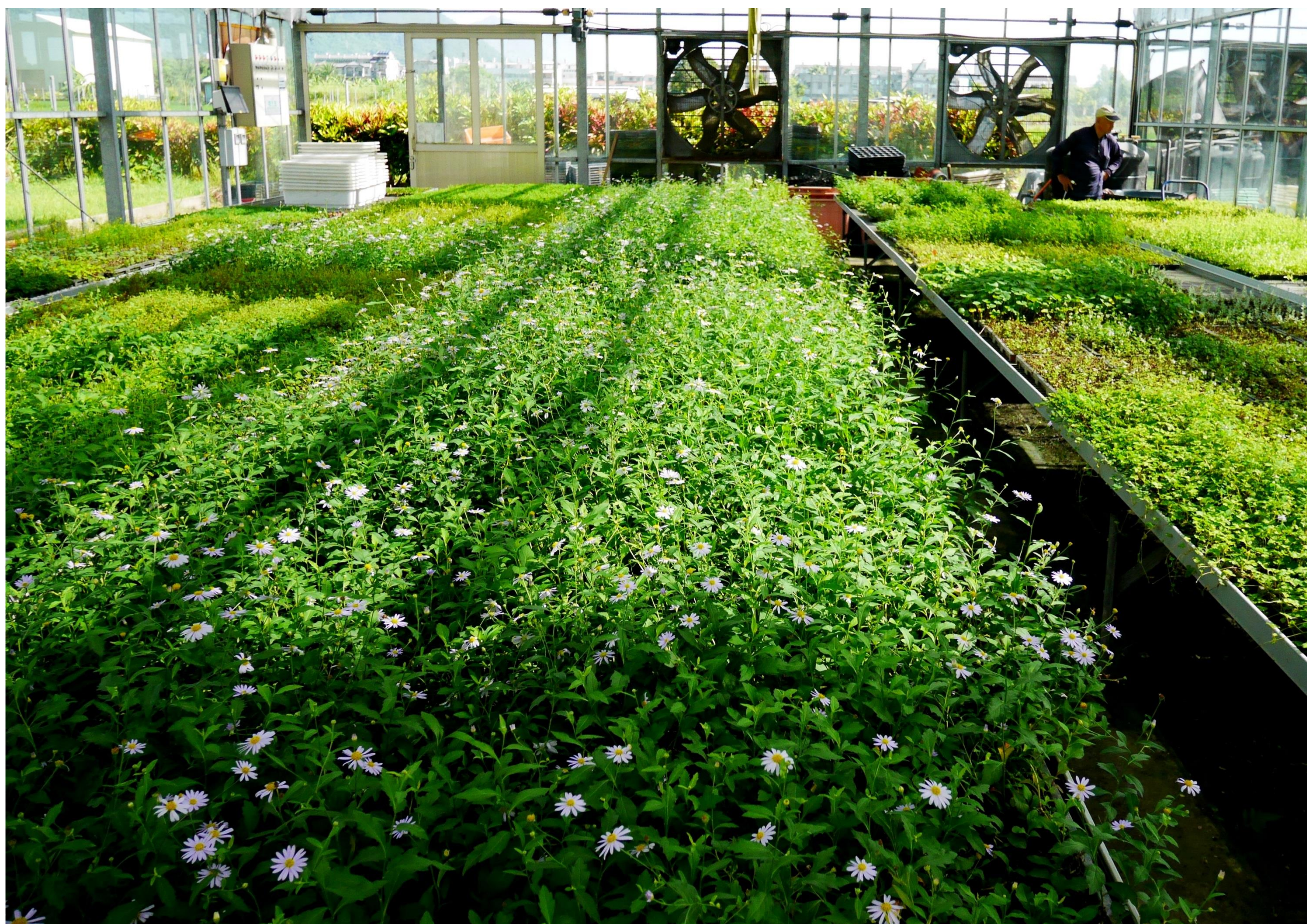
利用多種原生植物培育原生野花植生毯。

臺灣原生植物的保護與復育逐漸受到政府單位與大眾重視，但長時間的破壞與忽略，已造成大量原生植物種原及族群流失。本場蒐集篩選多種台灣原生野花，依環境適應性、植株生育特性與利用目的等搭配不同原生植物組合，開發原生野花植生毯。可應用於景觀與生態營造。台灣原生野花植生毯有別於以往單一物種的草毯，多樣化原生植物混植搭配，可增加草毯對於環境變遷耐受性，亦會隨著季節演替消長。原生野花植生毯可直接鋪設，快速建立多樣化原生野花植被，降低失敗機率。可用於植被復育，亦可應用於都會公園、庭園造景以及校園環境教育等。