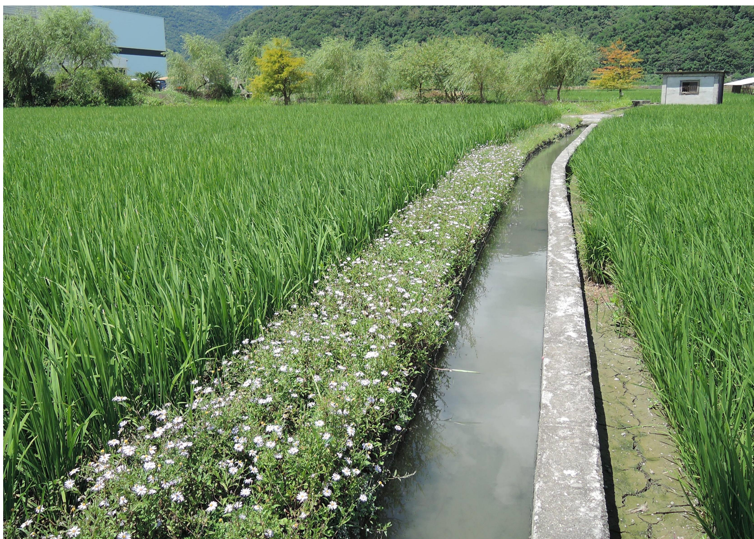
原生野花植生毯應用於水泥田埂植被復育，有助於營造農田生物多樣性。