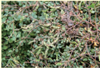
圖3. 蠅翼草未成熟果莢，成熟後轉為褐色，可用於繁殖。

蠅翼草可利用種子及扦插繁殖。蠅翼草種子量雖多，但需收集節莢果後再分離種子(圖3)，過程繁瑣，故一般繁殖上不採用。扦插繁殖較簡易，因蠅翼草的莖部每節均會發根。插穗帶有3至4節節間為佳，將1至2節間埋入濕潤土壤中，保持介質潮濕及適度遮陰，約1至2週後即會發根與生長新葉(圖4)，3至4週根系發育飽滿即可定植。扦插適宜季節依節氣以春分至秋分為最佳。因蠅翼草屬於熱帶草種，氣溫較高時生長速度較快；冬春兩季氣溫低時進行扦插，則恢復期長生長緩慢，若遇寒流低溫則不易存活。