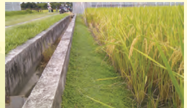
圖6. 蠅翼草應用於水稻田埂，有效抑制雜草。

(二) 水、旱田田埂：蠅翼草種植於水、旱田田埂，均可快速形成良好覆蓋，有效抑制雜草(圖6)。又蠅翼草無法生長於過濕土壤中，故可適用於水稻田，其生長至水邊處會自然停止(圖7)，無蔓延至水田中成為雜草之疑慮。尤其有機水稻田可考慮採用蠅翼草做為田埂地被，可節省人工砍草費用、美化環境及營造蛙類生存棲地。