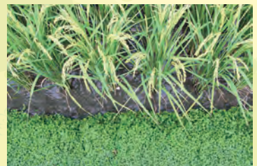
圖7. 蠅翼草無蔓延至水田中成為雜草之疑慮