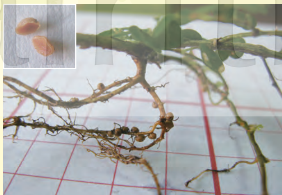
圖 8. 根部根瘤豐富，根瘤內部呈紅色，為具固氮作用的有效根瘤。

施肥，才能維持良好景觀。蠅翼草具終年翠綠、耐壓性中、耐旱性佳、可間接減少病蟲害及對臺灣風土適應性良好等特性，可作為綠美化之優良選擇。且其為豆科植物，於自然環境下根部根瘤豐富，根瘤內部經檢視為紅色，為具有固氮作用的有效根瘤（圖 8）。所以採用蠅翼草草坪，全年可不施任何肥料；又其莖部為貼地匍匐生長、不攀爬，可全年免割草或僅於初夏期間割草一次，即可營造賞心悅目之草坪地景 (landscape)，為一易管理、低維護、節能減碳的生態草坪。禾本科草坪常因土地貧瘠、堅硬或乾旱，而出現禿塊泥土外露現象，如與蠅翼草混植，即可填補這些生長不良處，維持整片草坪翠綠（圖 9）。