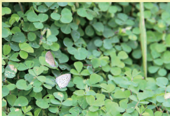
圖 15. 蠅翼草為微小灰蝶食草

重要工作；初期雜草防除應連根拔起，避免雜草再次生長。中期蠅翼草逐漸形成覆蓋時，為避免雜草成熟產生眾多種子，應趁早拔除或利用殺草劑點除；禾本科雜草為害時，亦可利用選擇性殺草劑，如伏寄普、芬殺草、快伏草等加以防除。後期蠅翼草已形成良好覆蓋時，雜草管理較簡易，拔除突出之零星雜草即可（圖 14）。