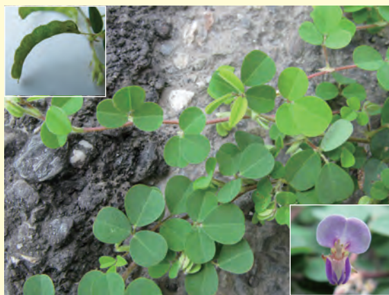
圖 1. 蠅翼草植株及花、莢果形態。

腹面收縮被鉤毛，成熟時會斷裂成 1 節具 1 顆種子之節莢果。種子長方形，淺灰褐色。臺灣全島中低海拔空曠地均可見。蠅翼草生長強健，四季常綠 (圖 1、圖 2)，草層厚度為 4 至 10 cm，全日照