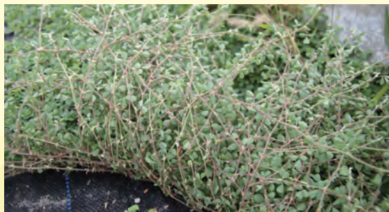
圖 2. 蠅翼草分枝繁多，每節均會發根，容易形成覆蓋，為優良之地被植物。