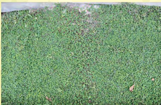
圖 12. 草毯定植 3 週後，可見明顯覆蓋。