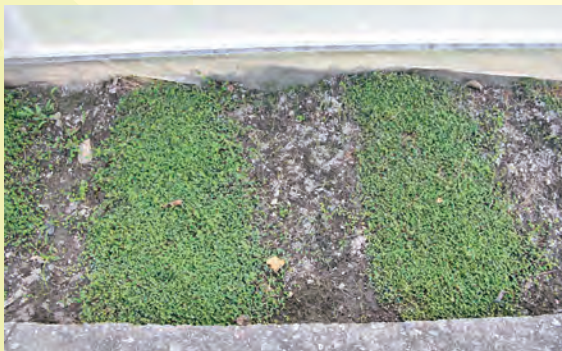
圖 11. 蠅翼草草毯初期定植

入蠅翼草苗株 (圖 10)。此方法之特點為：抑草紙初期可有效抑制雜草，待蠅翼草完全覆蓋種植地，因土壤表面微氣候改變，溼度增加抑草紙即會逐漸自行分解，不必另工拆除。此法初期需額外負擔抑草紙成本，但可大幅降低初期之雜草量及除草負擔。另本場亦建立另一最新利用模式，將培育好之蠅翼草草毯鋪於種植地即可，如同一般禾本科草皮的鋪植方式，具有省工快速覆蓋之優點 (圖 11、12)。該項草毯生產技術，未來本場將以非專屬授權方式，辦理技術移轉推廣運用。