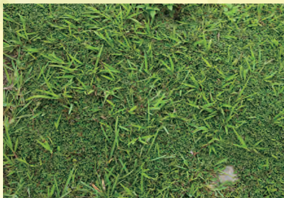
圖 9. 蠅翼草與禾本科地被混植，填補草地禿塊，營造豐富之視覺效果。

（一）整地及前置作業：首先需清除待植區內非土壤之異物，如石塊、樹枝、垃圾或是任何大於 4 至 5 公分之硬物。如欲植地雜草過多時，需先除去。除直