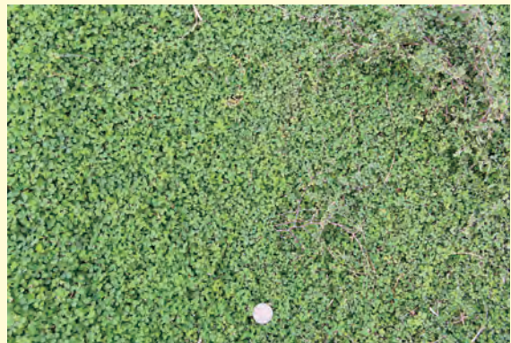
圖 13. 左方為供水充足，右方為較乾旱處，可見供水充足者葉片較翠綠且較大 (圖中為十元硬幣)。

(三) 灌溉管理：蠅翼草快速成長之季節為春分至秋分，約為 3 月底至 9 月底。於此段時間若水分供應充足，蠅翼草生長相當快速，反之則生長遲緩 (圖 13)。若於水田田埂應用，一般而言灌溉較容易；若於旱田田埂、農路、景觀綠美化或距水源較遙遠之大面積使用時，較理想之作法為增設噴灌系統，方能使蠅翼草蓬勃生長，於短時間有效覆蓋種植地。冬季氣溫下降時，蠅翼草生長遲緩或停頓，若水分供應充足，仍可維持翠綠之外觀；若土壤長久乾旱，則容易導致黃化枯萎，甚至死亡。故冬季仍需注意水分供應，避免土壤過乾，以維持蠅翼草之良好狀態。