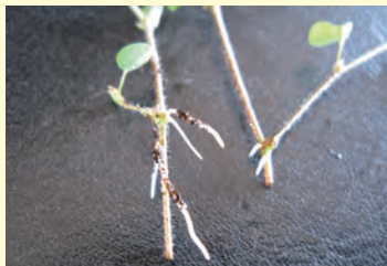
圖4. 蠅翼草扦插1至2週後即會發根