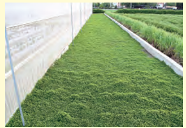
圖5. 蠅翼草應用於農路景觀全覆蓋後，土優美

層表面光照度僅為 27~195 lux，可有效抑制多數雜草萌發生長，大幅減少雜草數量，間接的控制病蟲害(例如田間多種雜草皆為蚜蟲寄主)、減少除草劑使用降低環境汙染、美化地景。