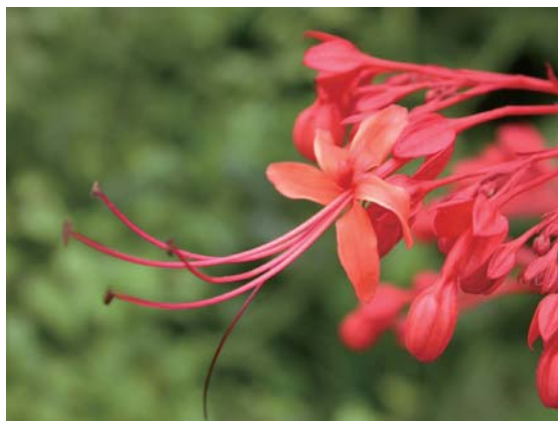
龍船花的一朵完整小花

龍船花在台灣全島分布的區域相當廣泛，取得容易，台灣原生的龍船花有紅花及白花2種花色，花型一樣碩大而顯目，具有中大型紙質葉片，除了園藝觀賞上盆栽及庭園造景的用途外，二者也都是民間常用的藥用植物。台灣原生及歸化的馬鞭草科植物共有11屬34種及3變種，其中除了龍船花可供觀賞利用之外，還有許多種類如杜虹花、紫珠、山茉莉、苦林盤、馬櫻丹、鴨舌癩、黃荊、臭娘子、馬鞭草、蔓荊等植物，可以提供盆花、盆景及庭園景觀等觀賞用途，日後將持續進行觀察並開發利用。