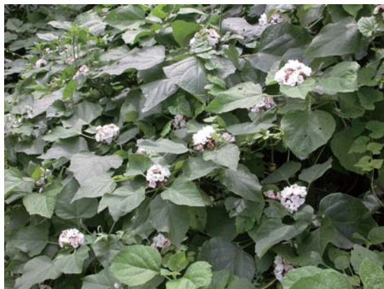
↑ 山茉莉之芳香花海

春天可再修剪一次，以便促進側枝的發生及整齊度，接著就好好等待花期再一次的到來。盆花或花壇種植若側芽過多而太擁擠時，應進行換盆或分株疏植，並略施輕量肥料，以免影響生長勢。