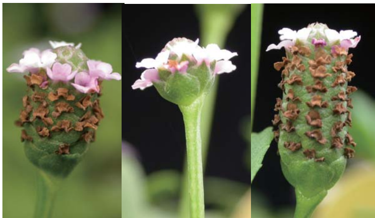
↑ 過江藤的花序由下而上開放漸成短柱狀，枯萎的花仍宿留不脫落