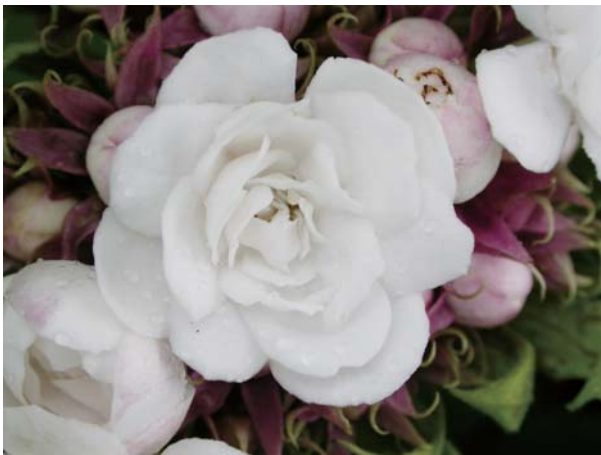
↑ 山茉莉盛開的單朵小花，純潔而芳香

「山茉莉」是台灣的原生植物之一，光看植物名稱就知道它具有近似茉莉花的香味，花型及花色也與白花重瓣的茉莉很像，不同的是茉莉花是藤本植物，而山茉莉為直立之灌木，植株較為高大，株高約1.5~2.5公尺，花朵數多且群聚於莖頂，盛花期在4月至5月之間，最晚可陸續開放至9月，山茉莉是一種既潔白又芳香的台灣本土香花植物，深具觀賞價值。