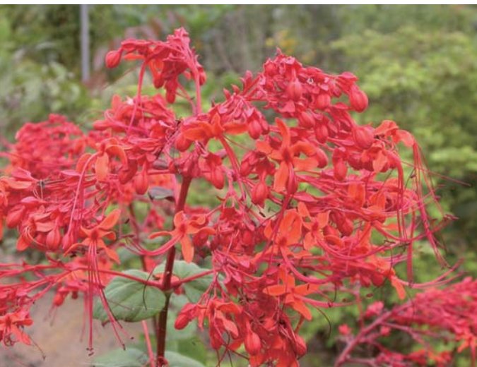
龍船花碩大且紅艷的花序綻放在植株的頂端