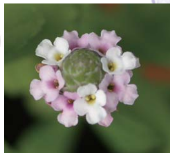
↑ 過江藤之小花顏色多變