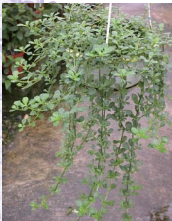
↑ 過江藤的吊盆，有自然垂懸的風趣