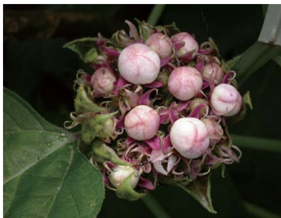
↑ 山茉莉的花苞為粉紅色，花萼為淺紫色