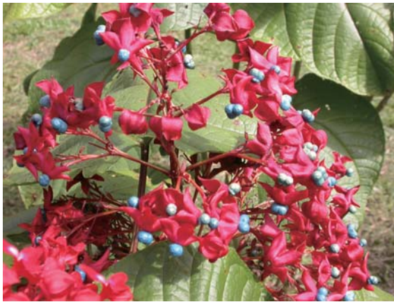
← 龍船花的藍綠色果實

「龍船花」是一種既好看又好種的台灣本土花卉，在粽葉飄香的端午節前後陸續開花，花序綻放在植株的頂端，因花型碩大且色彩紅艷，看起來就像古代皇帝出巡時所乘坐之龍船頂上的大旗幡，深具觀賞價值，很適合做為庭園叢植、綠籬景觀及盆花之利用，是國人居家或公共空間綠美化之新選擇。