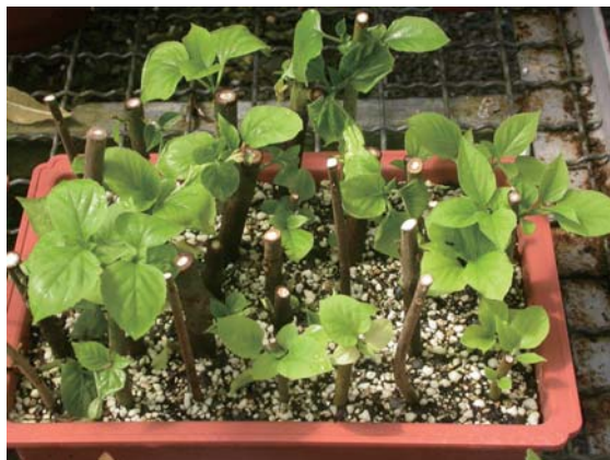
↑ 山茉莉可利用扦插方式繁殖

山茉莉具有挺立叢生的植株，其大葉片心形呈粉綠色，頭狀聚繖的花序之花朵眾多且聚集莖頂端，且芳香怡人的白色或淺紫色花朵，可培育成爲7~10吋的中、大品盆花、庭園叢植或綠籬景觀，而且觀花、觀葉或聞香都很適合。