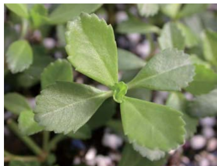
↓ 過江藤的葉片十字對生，具疏鋸齒