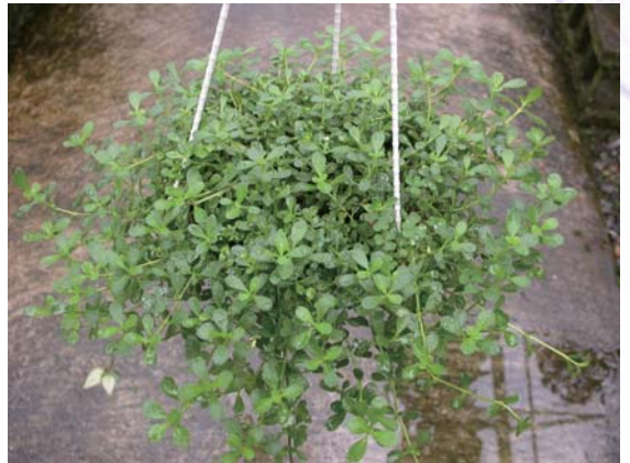
↑ 過江藤的葉片翠綠而密集

盆栽管理：過江藤盆栽為增加其分枝數及綠葉數，於蔓莖過長時或開花後可進行1次之修剪，以增加其植栽之叢生性，強剪亦須留取2~3對葉片為宜，並適量施加追肥，如此可常年維持觀賞性盆栽。