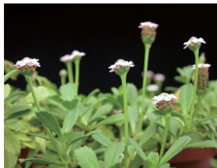
↑ 過江藤的盛花期繽紛熱鬧

過江藤具有數目眾多而翠綠的葉片，且密集著生於細長的匍匐莖上，因而可將其視為觀葉植物來利用，盛花時期則又兼具觀花的價值，花期甚長，適合培育成中小型的吊盆或高腳盆等盆栽，欣賞其匍匐莖帶著花葉由上而下的垂懸姿態，除了盆栽利用外，亦可作為庭園的地被景觀配置用。