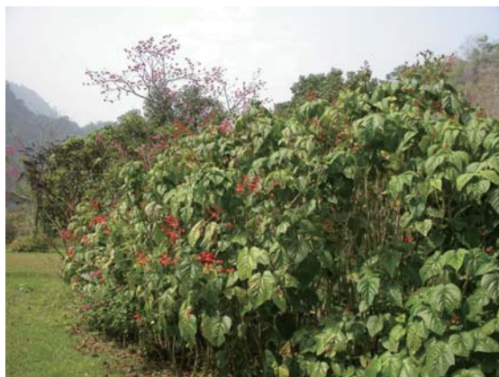
龍船花於山野步道旁坡地的自然狀態