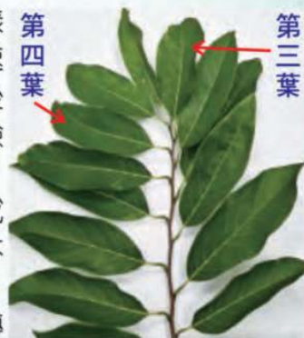
採非結果枝第三或四葉

詢問採集方式或檢驗報告，可逕洽本場土壤肥料研究室，電話089-325110轉720或722。