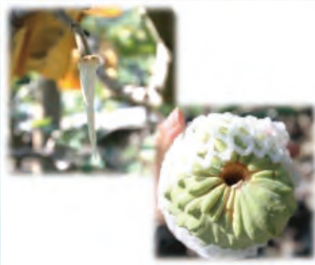
圖1. 鳳梨釋迦抽心落果

果實在生長發育過程中，非因機械外力或病蟲危害造成果實尚未成熟即從樹上脫落的現象，稱為「生理落果」，大致可分為「早期落果」和「採收前落果」兩類。「早期落果」是發生在果樹著果初期的小果脫落，發生的主要原因多為授粉不完全、受精未成功；而氣候異常是重要的影響因子，惡劣的環境例如高溫焚風、低溫寒流或連日霪雨，造成花器發育不良、花粉活力受限或是傳粉過程受阻，最終導致受精失敗而落果。「採收前落果」是發生在果實發育後期，已接近成熟的果實從樹上掉落，不同作物落果的表現不一樣，其落果高峰期也不相同；落果原因可歸納出幾個：1.果實與枝條生長的養分競爭；2.水分與養分供應失衡(過多或不足)；3.逆境加速成熟老化、產生離層。