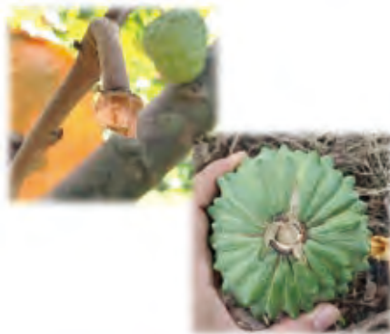
圖2. 鳳梨釋迦斷心落果