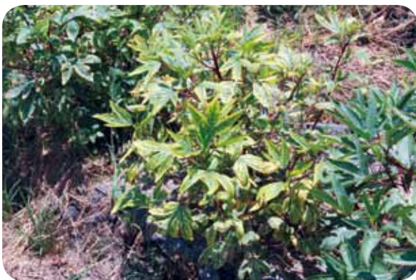
圖 2. 洛神葵菌質體病害之主要病徵為葉片黃化、植株矮小。

植物菌質體病害在田間主要是藉由媒介昆蟲傳播，在由同樣是菌質體造成的甘藷簇葉病病害研究發現，牽牛花、馬麻藤、白牽牛花及長春草等植物為該病菌的中間寄主。洛神葵為一年一作的作物，一般為每年 4 月開始播種，最晚 12 月底即採收完畢。同一塊地接著會種植臺灣藜或小米等其他作物，因此在排除種子傳播的可能性後，顯然菌質體於非洛神葵栽培期間，即已存在於田間的中間寄主，待洛神葵開始種植時，再由二點小綠葉蟬傳播，因此本場也正努力釐清洛神葵菌質體可能的中間寄主，希