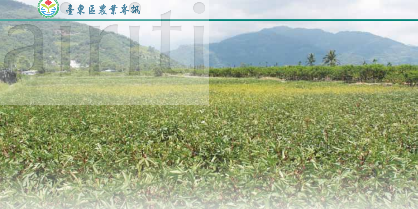
圖 1. 洛神葵菌質體病害田間大面積發生情形。圖片中央大面積黃化區域即為菌質體病害發生區塊。