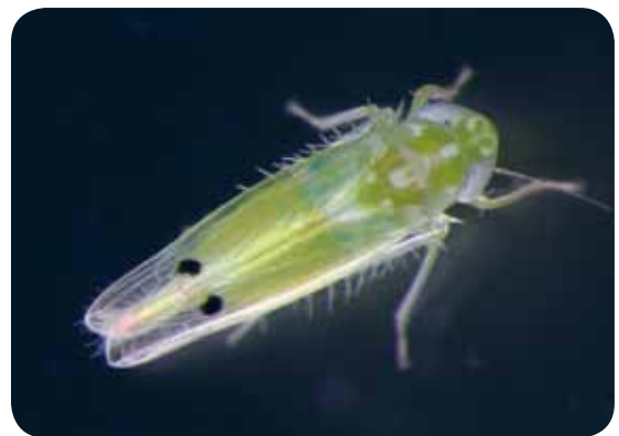
圖 3. 傳播洛神葵菌質體病害之媒介昆蟲 - 二點小綠葉蟬 (放大約 25 倍圖)