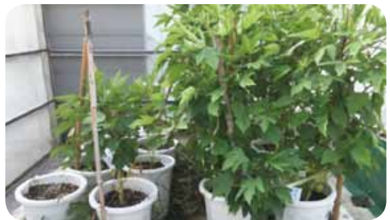
圖 5. 種子來自病株（左）的生長較來自健康植株（右）矮小

近年來本病害已嚴重影響轄區洛神葵產業，提醒農友務必做好害蟲管理與病害防治工作，以確保收成。農友在防治上若有任何問題，歡迎來電洽詢本場植物保護研究室（電話 089-325015）。