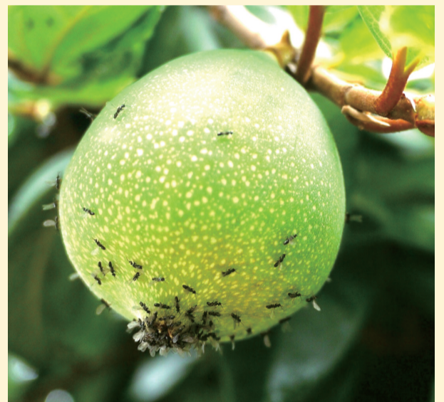
愛玉子開花時會散發宜人香氣，吸引愛玉小蜂前來造訪