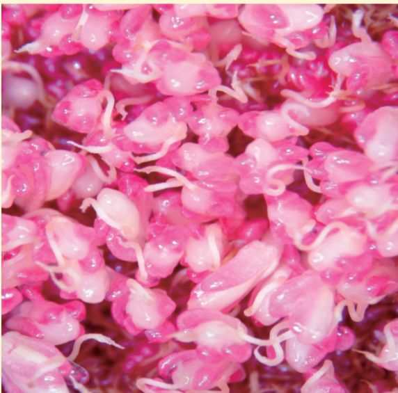
愛玉子雌花（左）與雄花（右）均為夢幻的粉紅色

為了吸引愛玉小蜂的青睞，愛玉子在開花時會釋放一種淡淡的花香味，吸引數公里外的愛玉小蜂造訪及定居，而現正值愛玉子開花的季節，若下次經過愛玉子果園，不妨停下腳步，深呼吸一口，品聞一下愛玉小蜂最喜歡的芬芳香味。