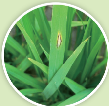
水稻葉稻熱病病斑