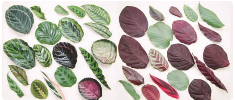
圖2. 竹芋葉片正面(左)與背面(右)具有美麗的斑紋與色彩