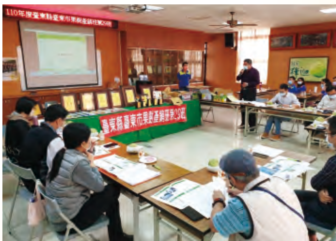
本場邀集評選小組進行實地訪視遴選評核，由產銷班備妥資料進行簡報說明，再由委員詢問並提供建議。

案滿1年，且於地方農會辦理之考評，初評成績達95分以上者(總分為120分)。條件符合之產銷班經由農會、公所、合作社及產業團體等輔導單位先進行鄉(鎮、市、區)第一階段評選推薦，並將推薦名單送至縣市政府進行第二階段評選，獲選者再送至各區農業改良場辦理區域評選。各區農業改良場則視各入選產銷班之產業別，邀集相關農政單位、專家及學者組成評選小組進行實地訪視評核，確認產銷班營運狀況，最後將轄區遴選出之績優產銷班資料送至農委會進行全國評選。農委會籌組評選委員會，以投票方式進行評選，票數前10名列為全國十大績優農業產銷班，11至20名則為全國優良農業產銷班。