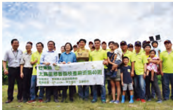
太麻里鄉番荔枝產銷班第40班以年輕班員為主，組織運作管理良好，充滿活力。