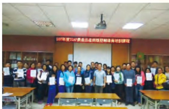
榮獲全國十大績優農業產銷班之班員配合政策，積極參加產銷履歷輔導員培訓課程。