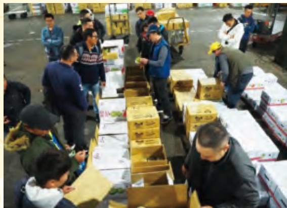
太麻里鄉番荔枝第40班藉由完善共同運銷及包裝作業降低生產成本，提升班員收益。

性也做好把關，通過取得農產品驗證標章，對於拓展行銷通路有所助益，如臺東市果樹產銷班的29班班員農事技術精湛，參加各項農業相關競賽，成績優異，班員陸續獲獎，並取得產銷履歷驗證，成為其他農友的學習典範。在「政策配合度」方面，遵循農業政策與社會脈動趨勢，如重視食安、轉型有機友善環境耕作、青農或女性班員增加以維持團體活力，避免組織老化等。能綜合以上特點並持續不斷精進，才足以成為其他產銷班的典範。