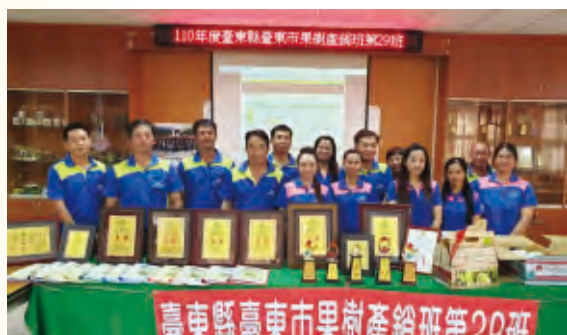
臺東市果樹產銷班的29班班員參加各項評鑑獲獎無數，成績相當優異。

性也做好把關，通過取得農產品驗證標章，對於拓展行銷通路有所助益，如臺東市果樹產銷班的29班班員農事技術精湛，參加各項農業相關競賽，成績優異，班員陸續獲獎，並取得產銷履歷驗證，成為其他農友的學習典範。在「政策配合度」方面，遵循農業政策與社會脈動趨勢，如重視食安、轉型有機友善環境耕作、青農或女性班員增加以維持團體活力，避免組織老化等。能綜合以上特點並持續不斷精進，才足以成為其他產銷班的典範。