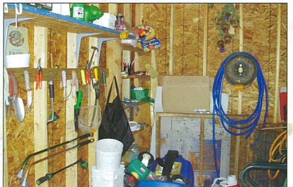
花園裡的全套工作配備和倉庫，志工隨時可來作花園的事