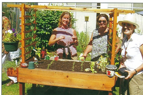
木製高植床方便病人操作