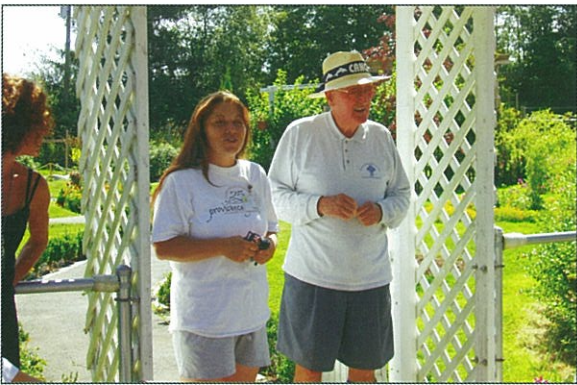
Anderton企業捐贈地作園藝治療花園並讓志工有發揮之地