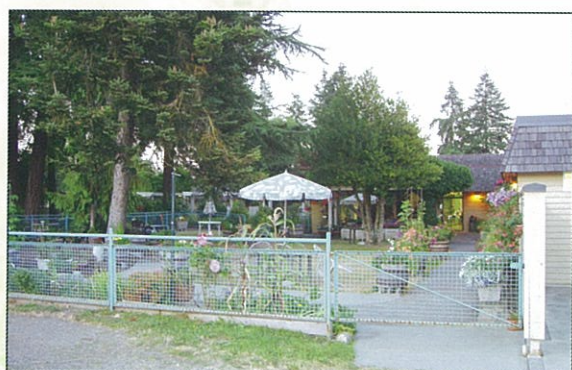
在Duncan 的Carismore Extended Care