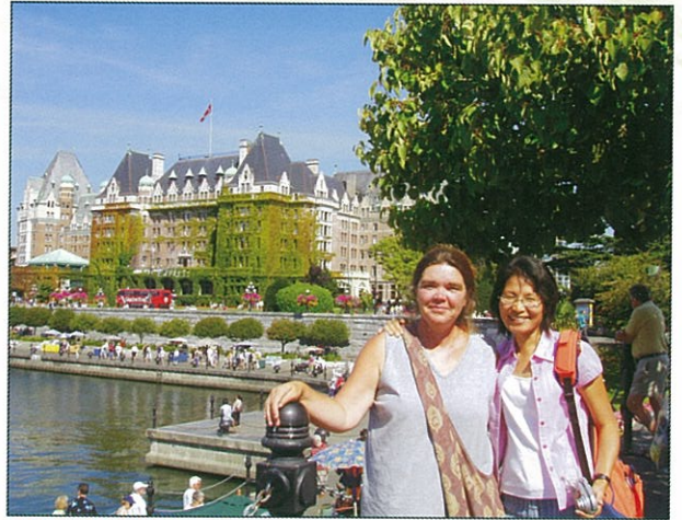
與學員共遊維多利亞