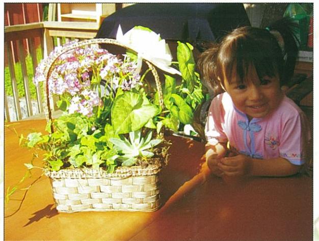
友人的小孩與客人送的花籃