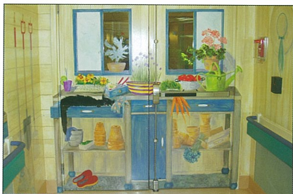
醫院內的牆壁彩繪蔬菜、水果、花草圖案，讓人有親近感