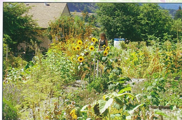
農場種的菜和花可以賣來作基金或拿回家用