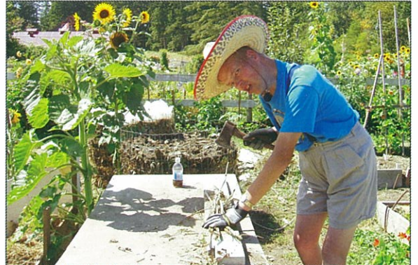
工作人員熱切介紹他的工作