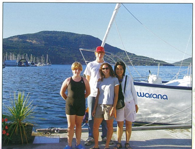
與 Home - stay 出外游海