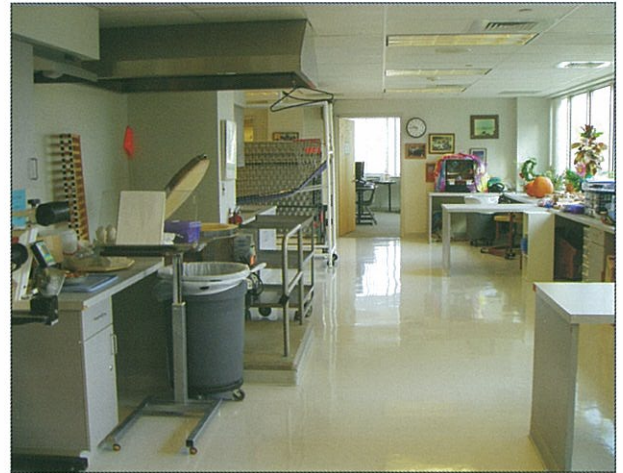
室內園藝活動配備