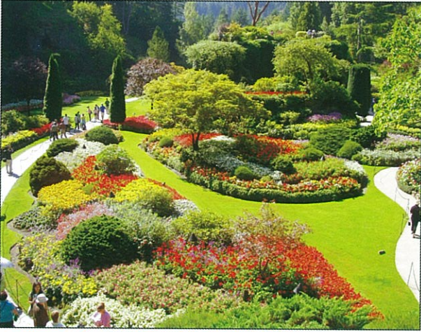
七月是加拿大的布查花園最美的季節