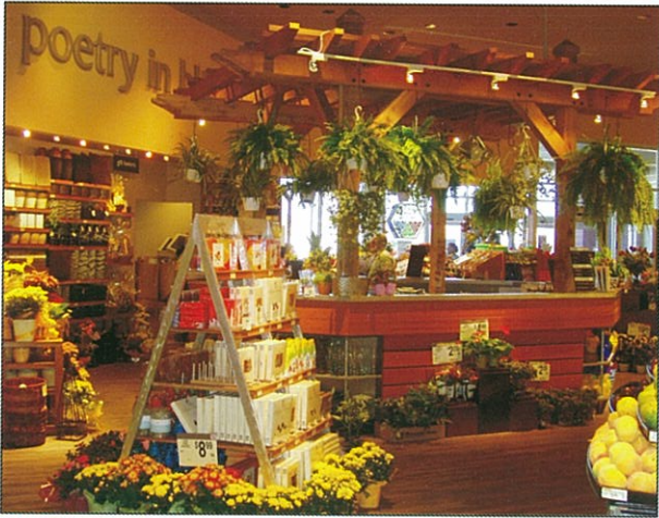
逛 Supermarket 是我的最愛