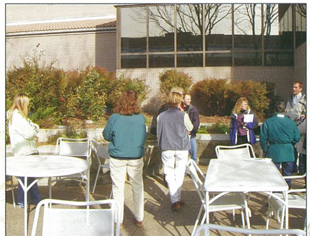
學員們在戶外曬太陽，交流較熟絡