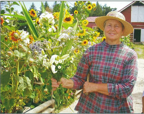
退休老師當起愛心媽媽作園藝職能治療