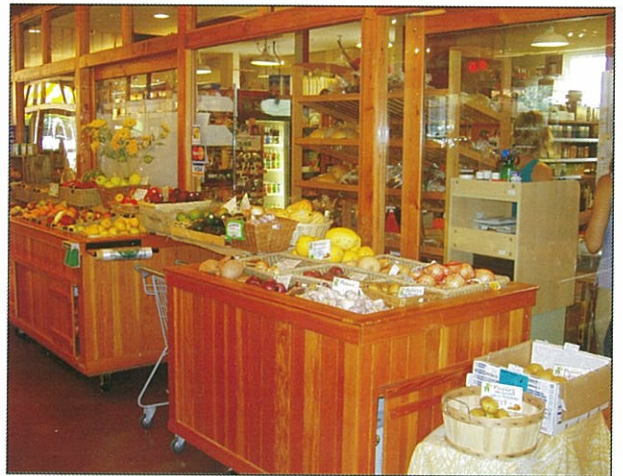
到雜貨店去找家鄉的食材，應有盡有