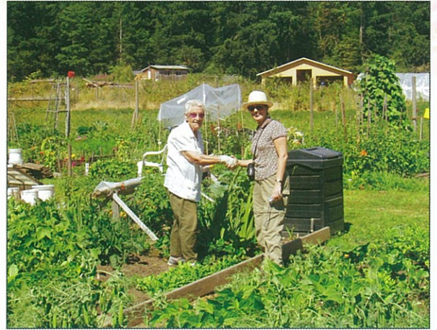
種菜、種花是老人家最好的運動