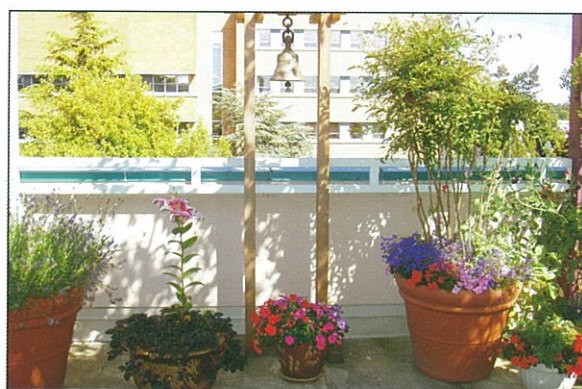
設在頂樓的空中花園