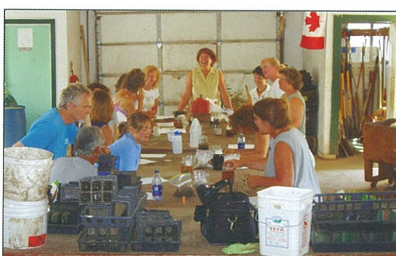
在工作棚內上土壤課