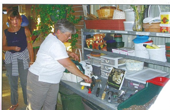
中心內的園藝治療師原來是這裏的護理人員