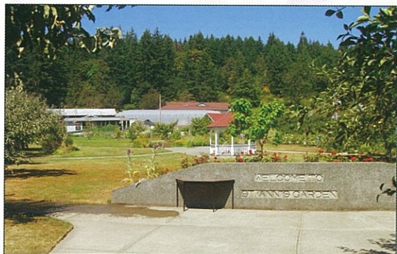
Providence Farm 全景

點課地點位在Duncan的Providence Farm，當地人稱愛心農場， 整個課程是一邊上課一邊與病人互動，學習他們農場的工作，每周有一天是戶外參訪。