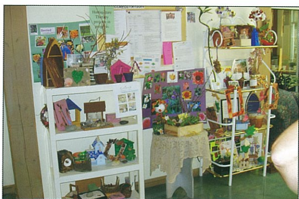
院內的住戶園藝治療程作品展示