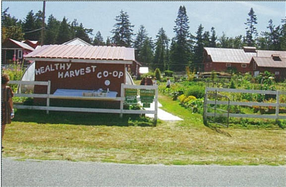
Glamorgan Farm 是一個職能治療農場，接受並訓練智障者在這裏工作