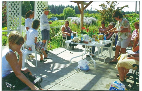
園內提供優雅的休閒環境