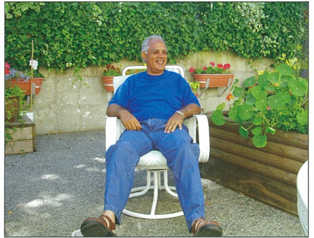
班上學員總是愛坐在樹下乘涼