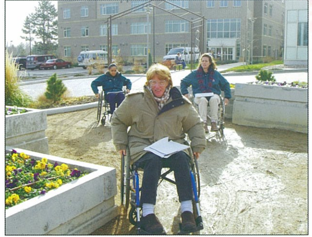
學員親自體驗當病人