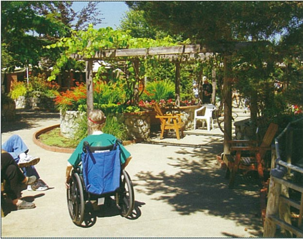
病人需要植物比健康人還多