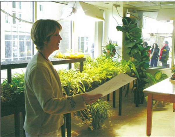
醫院請的非全職園藝治療師作院內室內植物介紹