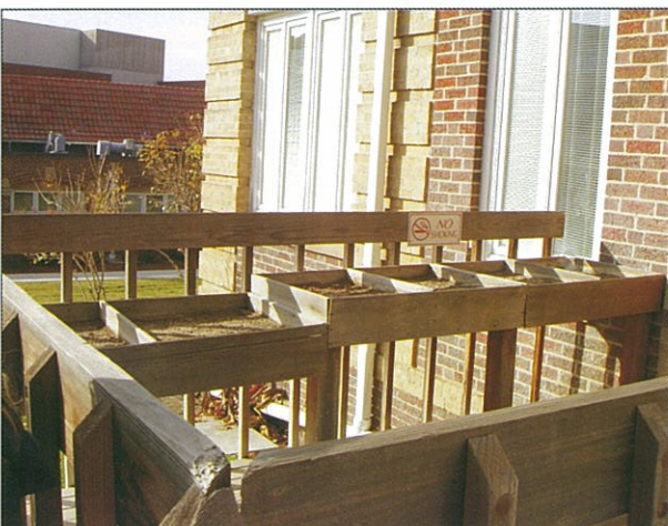
方便病人站著種花草的植床