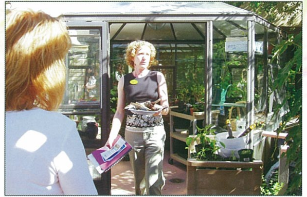
院內有園藝治療師和配備