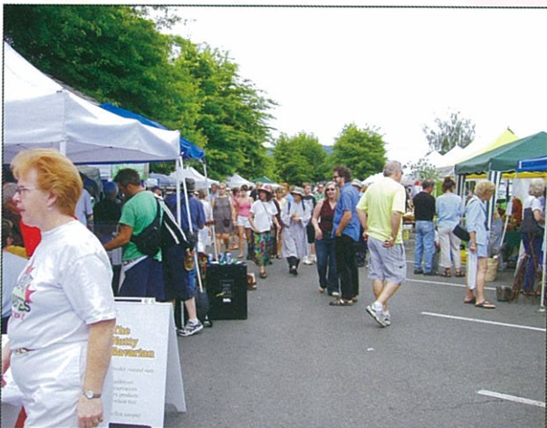
假日的農夫市集是 Ducas 人首要推薦去的地方