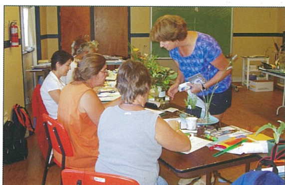
作各種類型種子袋貯放或送人用