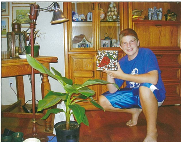
Home-stay 的小孩的寵物是香蕉