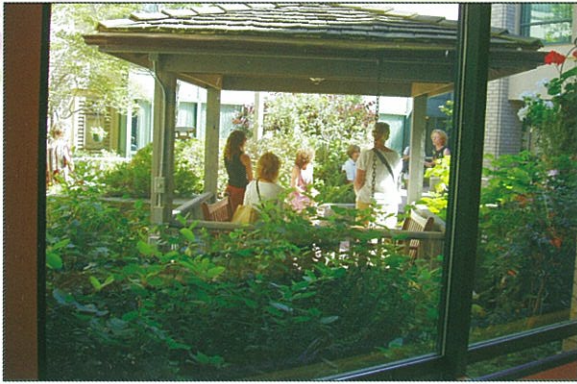
二次大戰退伍軍人的安養院在 Broadmea