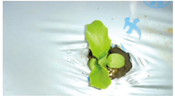
若為防止雜草孳生，也可於畦面覆蓋蓋塑膠布後再打洞定植。

鬆。整地作畦時建議畦寬(1畦面+1畦溝)為1公尺，畦高至少25~30公分，定植時每畦種植2行，株距為30公分。萵苣長出本葉4~5片時，根系已發育成根群，是移植的最好時機；若苗株取自育苗盆裏的擁擠苗，要小心的分開來，不要傷到根部，種植深度以土壤覆蓋高度不超過子葉為原則。