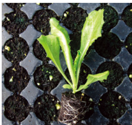
本葉4~5片時為定植適期。

庭園栽植之耕土(碎土)至少需20公分的深度。若庭園面積在5~15平方公尺範圍，也可購買蔬菜栽培用之培養土或泥炭土2~6包(70公升裝)拌入庭園土壤內，增加土壤蓬