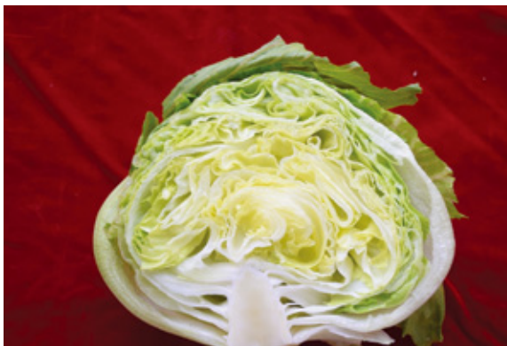
生食用，葉球內仍保有較多空隙。

採收適期，以葉球尚未充分緊實至充實緊密時都可採收；若食用目的為生食，建議葉球以手輕壓感覺硬實但仍有彈性時採收，因易於剝離葉球，且易保留每一片葉之完整性；若做為煮食用，則可留至葉球充實緊密時採收。🌱