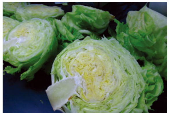
緊實葉球以供煮食用為主。