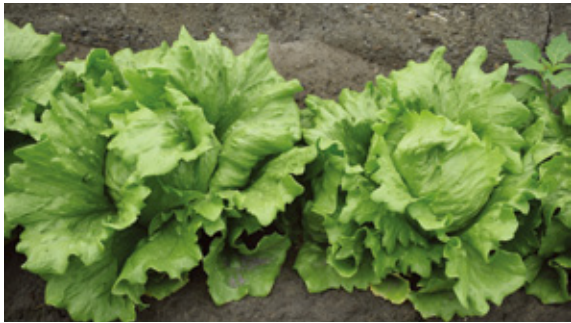
結球中期施第三次追肥。