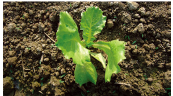
葉6~8片時施第一次追肥。

結球萵苣生育期間短，可施用速效性肥料促進生長。但若採用有機栽培，需注意一般有機肥料以含氮素肥為主，需另補充含鉀肥之有機資材，如棕櫚灰或草木灰，除部分需於定植前施入土中，也需於生育期間分次補充施用。