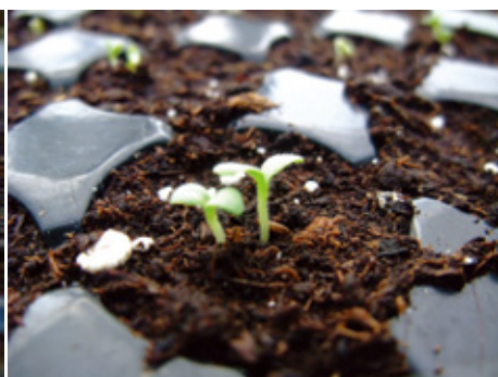
同一穴格長出2株幼苗時，可於子葉期進行間拔，僅留存1株健壯苗。