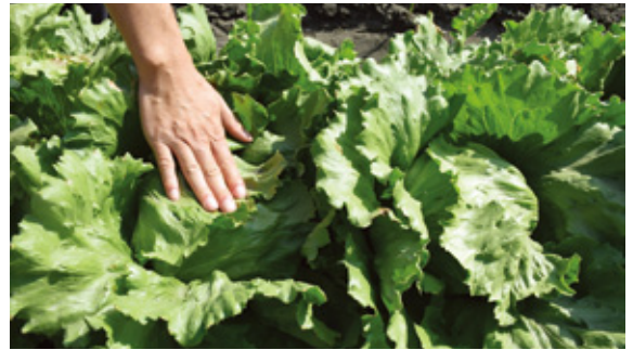
結球後期以手輕壓葉球，以判定可否採收。

3~4週)，施用30~45公克；第三次於結球中期(約定植後5~6週)，施用35~52公克。施用肥料位置應距離植株超過10公分，避免肥傷，建議施用後覆土以防肥分流失。