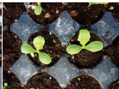
第1枚本葉展開後，可每週澆灌液肥2次。

澆水要濕透盆底，發芽前土壤表面避免呈乾燥狀態。播種後3~4天就會發芽，發芽後若1穴有2株苗以上，在子葉期即可疏苗留存1株。第1枚本葉展開起每隔3~4天(或1週2次)澆灌液肥1次；育苗期需20~25天，當本葉有4~5片展開葉時(不含發芽時之2枚子葉)，為定植適期。