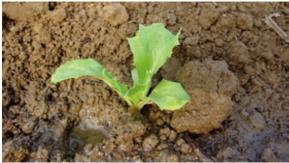
定植深度以覆土不超過子葉位置。