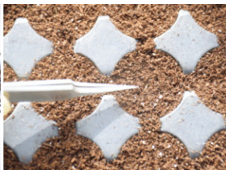
播種後覆土勿過厚，因光線可促進萵苣種子發芽。