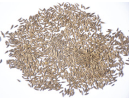
萵苣種子呈扁紡錘形。