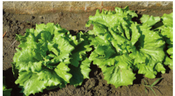
結球初期施第二次追肥。

若採行施用化學肥料之慣行栽培，建議使用「台肥43號」複合肥料(氮磷鉀三要素含量均為15%)，依不同生育階段分3次施肥。第一次為本葉6~8枚時，每平方公尺施用20~30公克；第二次為結球初期(約定植後