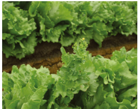
夏季高溫期種植，植株易提早抽苔(長出花梗及開花)。

可選用淺盆或128格穴盤育苗。採用穴盤育苗，建議1穴播1粒種子為宜，可省去間拔多餘苗株。播種後覆蓋薄土，需避免覆土過厚，因光線有助於萵苣種子發芽。播種後