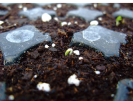
種子萌芽前應避免土表乾燥，以確保種子能充分吸水發芽。