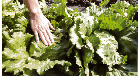
結球後期以手輕壓葉球，以判定可否採收。

3~4週)，施用30~45公克；第三次於結球中期(約定植後5~6週)，施用35~52公克。施用肥料位置應距離植株超過10公分，避免肥傷，建議施用後覆土以防肥分流失。