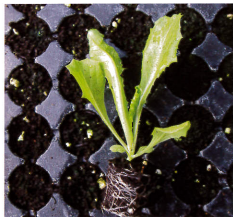
本葉4~5片時為定植適期。

庭園栽植之耕土(碎土)至少需20公分的深度。若庭園面積在5~15平方公尺範圍，也可購買蔬菜栽培用之培養土或泥炭土2~6包(70公升裝)拌入庭園土壤內，增加土壤蓬