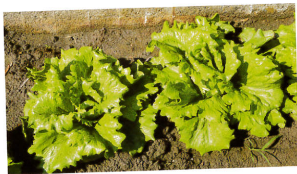
結球初期施第二次追肥。

若採行施用化學肥料之慣行栽培，建議使用「台肥43號」複合肥料(氮磷鉀三要素含量均為15%)，依不同生育階段分3次施肥。第一次為本葉6~8枚時，每平方公尺施用20~30公克；第二次為結球初期(約定植後