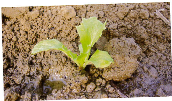
定植深度以覆土不超過子葉位置。

鬆。整地作畦時建議畦寬(1畦面+1畦溝)為1公尺，畦高至少25~30公分，定植時每畦種植2行，株距為30公分。高苣長出本葉4~5片時，根系已發育成根群，是移植的最好時機；若苗株取自育苗盆裏的擁擠苗，要小心的分開來，不要傷到根部，種植深度以土壤覆蓋高度不超過子葉為原則。