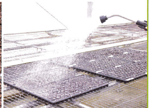
播種覆土後充分澆濕培養土，但澆水時避免土表積水造成種子浮出。