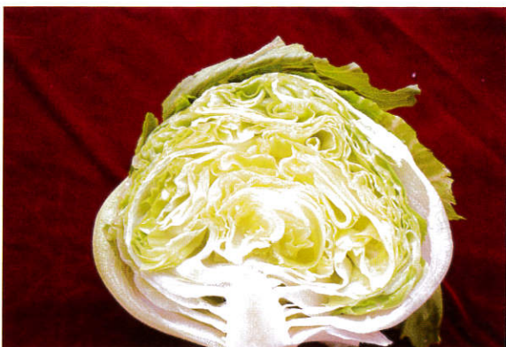
生食用，葉球內仍保有較多空隙。

採收適期，以葉球尚未充分緊實至充實緊密時都可採收；若食用目的為生食，建議葉球以手輕壓感覺硬實但仍有彈性時採收，因易於剝離葉球，且易保留每一片葉之完整性；若做為煮食用，則可留至葉球充實緊密時採收。🌱