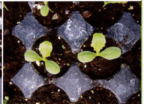
第1枚本葉展開後，可每週澆灌液肥2次。

澆水要濕透盆底，發芽前土壤表面避免呈乾燥狀態。播種後3~4天就會發芽，發芽後若1穴有2株苗以上，在子葉期即可疏苗留存1株。第1枚本葉展開起每隔3~4天(或1週2次)澆灌液肥1次；育苗期需20~25天，當本葉有4~5片展開葉時(不含發芽時之2枚子葉)，為定植適期。