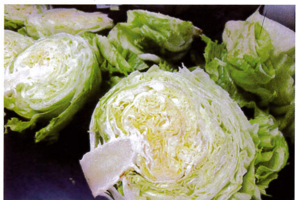
緊實葉球以供煮食用為主。