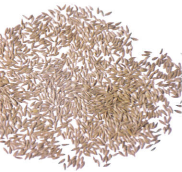
萵苣種子呈扁紡錘形。