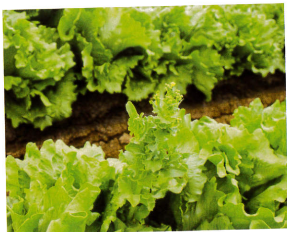
夏季高溫期種植，植株易提早抽苔(長出花梗及開花)。

可選用淺盆或128格穴盤育苗。採用穴盤育苗，建議1穴播1粒種子為宜，可省去間拔多餘苗株。播種後覆蓋薄土，需避免覆土過厚，因光線有助於萵苣種子發芽。播種後