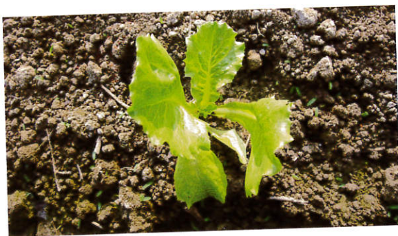
6~8片葉時施第一次追肥。