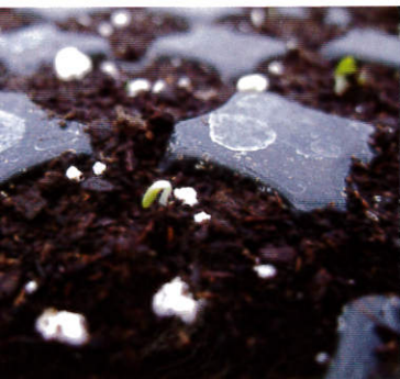
子萌芽前應避免土表乾燥，以確保子能充分吸水發芽。