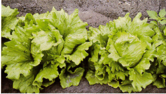
結球中期施第三次追肥。