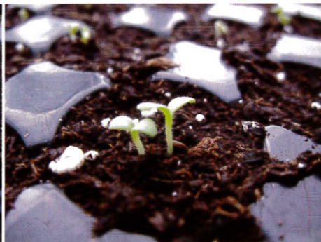
同一穴格長出2株幼苗時，可於子葉期進行間拔，僅留存1株健壯苗。