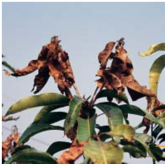
圖二：老熟幼蟲則化蛹於枯枝、落葉、樹皮甚至土內化蛹。

本蟲主要蛀入新梢及花梢危害，可擇用50%撲滅松（Fenitrothion）乳劑1,000倍或50%芬殺松（Fenthion）乳劑1,000倍或85%加保利（Carbaryl）可濕性粉劑850倍或30%