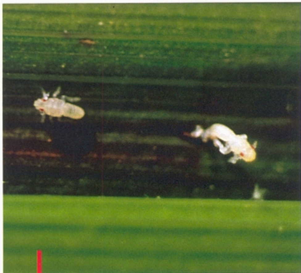
圖六：甫孵化之一齡若蟲。(鄭清煥)

0~1417個，平均約 300餘粒，短翅型成蟲產卵數略較長翅型者為高。成蟲壽命在室內飼育可達 20 餘天，但在田間平均短於 10 天。