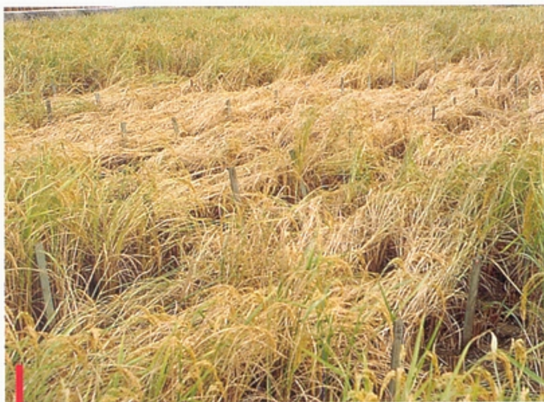
圖二：褐飛蝨嚴重危害導致局部「蝨燒」，更嚴重時可致使水稻全部枯萎。（鄭清煥）