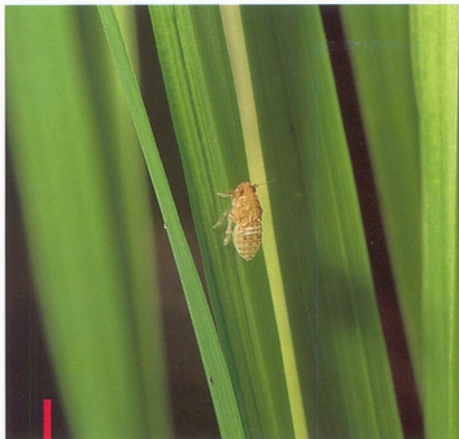
圖八：褐飛蝨三齡若蟲。(鄭清煥)

間變異頗大。雖然如此，但其族群密度通常在第一世代很低，第二世代若蟲期常可達到每叢稻5~10隻之經濟為害基準，族群高峰則出現於第三或第四世代若蟲期。隨該年之族群密度與氣象條件而異，若在水稻生育中期其族群密度較低，而十月份溫度仍高時，於第四代出現高峰期之機率較多。在族群高峰之密度可到平均每叢數隻至400隻以上。每叢水稻若遭受100隻左右危害即可產生「蝨燒」現象。