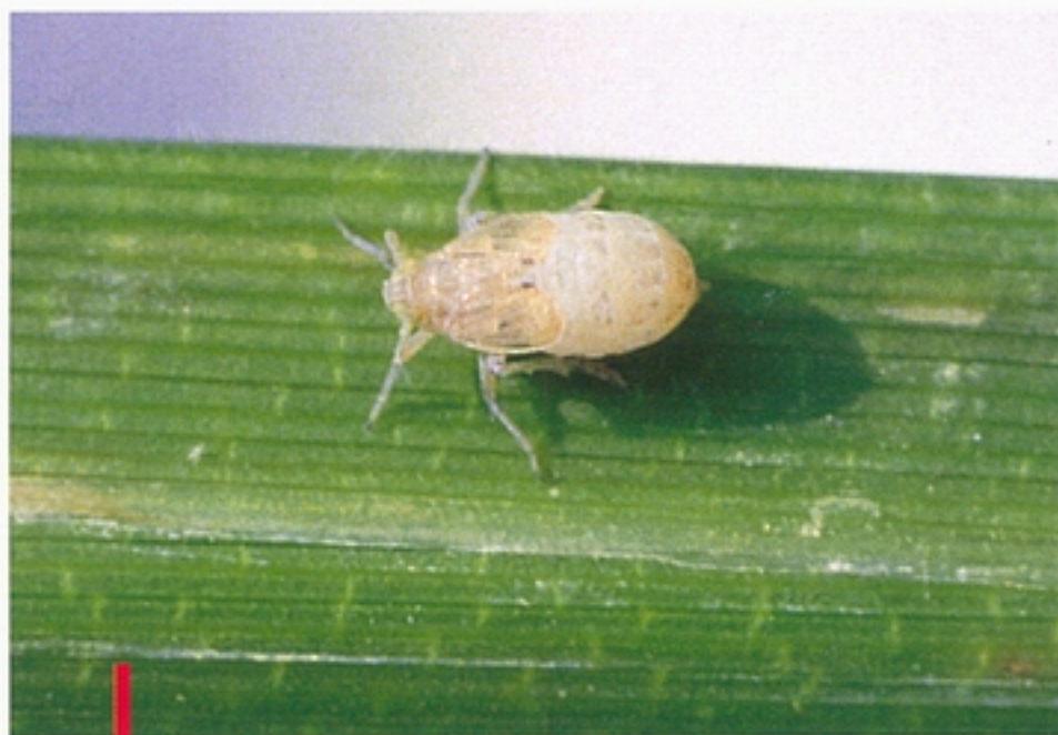
圖四：褐飛蝨短翅型成蟲。（鄭清煥）