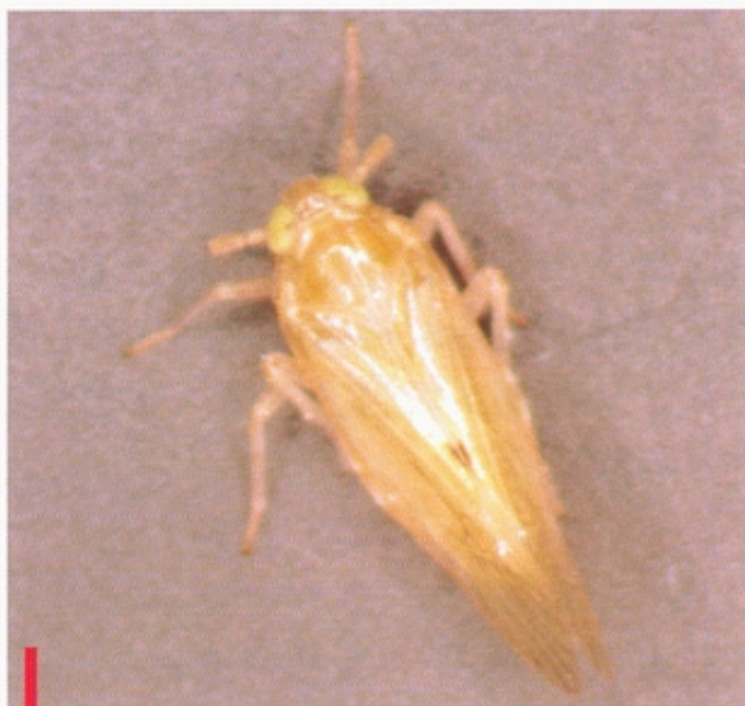
圖三：褐飛蝨長翅型成蟲。（鄭清煥）

五齡蟲：體長約 3.0 公釐，褐色，前翅芽長過第四腹節，蓋住後翅芽大部分。第五齡若蟲與短翅型成蟲容易混淆，但前者翅芽斜披兩側，端部尖，翅斑不明顯，後者左右翅靠近，翅端圓，翅斑明顯，雌蟲腹部肥大。